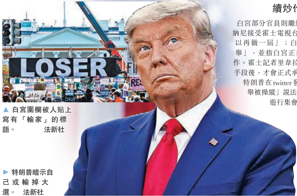
▲白宮圍欄被人貼上寫有「輸家」的標語。