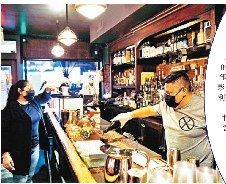
▲拜登團隊表示無意再封城。