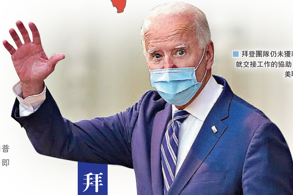
拜登團隊仍未獲華府就交接工作的協助。

美國媒體報導總統當選人拜登勝出佐治亞州和亞利桑那州，已累積306張選舉人票，加上總統特朗普陣營謀求翻盤的司法戰接連被駁回，特朗普雖尚未正式承認落敗，但他前日在白宮就新冠疫情召開記者會時，首次暗示自己敗選，稱「誰知道未來政府由何人入主」，分析指特朗普此言暗示他相信自己未能連任。據報特朗普已放眼下屆大選，包括計劃在拜登獲正式確認勝出後，即宣布自己將在2024年大選捲土重來。