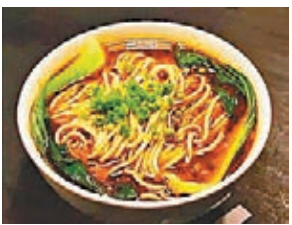
●香味四溢的小麵老師。

坐在重慶街頭小麵攤，吃着6元一碗、重慶人每天必吃的重慶小麵，看着重慶人在平凡樸實中活在當下，感恩大自然，我知道，重慶人和我都是小麵老師的好學生。感謝你啊，親愛的小麵老師！