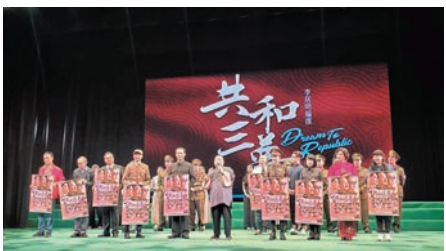
●李大師送大海報予每位演員！

於2020年李大師編撰了第35部劇《虛雲三夢》的第三部曲，下集大結局《共和三夢》，他告訴觀眾此劇是為推廣中國近代史，開創先河，也是他今天編劇的高峰時期的作品！