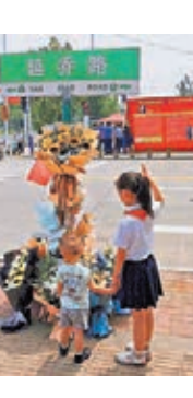
●民眾在安徽合肥延喬路牌下自發獻上鮮花。

村裏人，整體搬到新村了。那是處遠離山嶺的社區，到處為別墅式小院和樓房。村子舊址，變成了鄉村旅遊之地。周遭，幾片採摘區大棚，已初具規模。再遠些的規劃，也在不斷培植着。可以預見，各地的「大畧汪村」們，思路理清、筋脈打通後，都可以生。