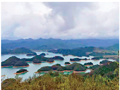
杭州千島湖百嶼出岫，千洲疊翠，與香港大欖涌水塘真有幾分神似。

水遠多仙境 山深少客蹤 雨絲風片裏 鳥語樹陰中 野徑分新竹 幽香出老松 霧雲縹繞處 萬碧托千峰