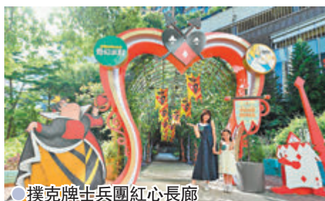
●撲克牌士兵團紅心長廊

同時，粉絲們萬勿錯過主題期間限定店，超過三百款精品於場內發售，更有為是次活動全新發行的精品，讓大家一起擁心愛色商品回家。至於一眾鍾愛拍照打卡的閨蜜們可親臨