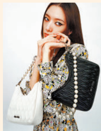
●中國情人節特別系列

Miu Miu 推出中國情人節特別系列，如靈動珍珠裝點 Matelassé，大顆人造寶石拼綴經典品牌標誌，奪目珠片鋪陳丹寧口袋。而運動造型渲染出街頭氛圍，女孩俏皮爛漫，盡情玩味趣致活力單品。