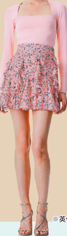
●英倫玫瑰色系搭配迷你花卉印花短裙

CELINE 以紅色元素點綴經典輪廓，推出全新七夕情人節別注系列，輕啟夏日浪漫序曲。例如，肩揹袋的甜美色調映襯經典 TRIOMPHE 金屬鎖扣，短肩帶設計更精巧隨性，打造時尚造型。全新中號 COUFFIN 手袋，用上搶眼的紅色 TRIOMPHE 標誌印花和 CELENE LOGO，亮麗的色調加上大容，自由搭配出清新的造型。