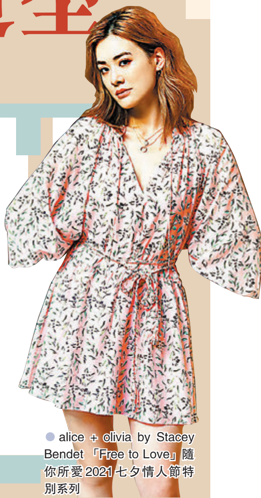
●alice + olivia by Stacey Bendet 「Free to Love」隨你所愛 2021七夕情人節特別系列