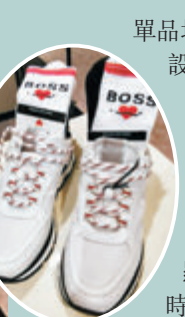
●獨特愛心圖案結合海豚微笑的單品

系列圖案的設計靈感源自海豚靈動的身姿及其標誌性的天使微笑。其獨特的愛心圖案結合海豚的微笑，以刺繡、印花和提花的方式呈現，將告白心意融入單品之中。而且，為迎合現今中性風穿搭趨勢，系列大部分單品均為男女同款，主打設計包括微笑和愛心圖案刺繡的基本款T恤和Polo衫；寬鬆廓形的短袖連帽衛衣、江豚圖案提花T恤和夏威夷襯衫則彰顯了更具活力的休閒時尚。