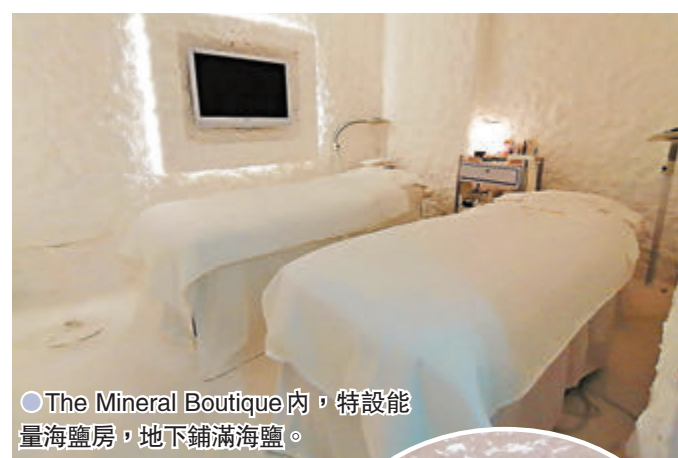
●The Mineral Boutique 內，特設能量海鹽房，地下鋪滿海鹽。

一站式美容概念店 The Mineral Boutique，位於銅鑼灣 Fashion Walk 名店坊，記得開幕時品牌特意邀請著名藝人陳茵媺擔任揭幕嘉賓，她認同品牌一站式美容概念，方便現代女性追求天然高效的護膚方案，同時純金護膚是西方美容潮流，歐美女星都喜歡純金護膚，陳茵媺亦曾親身體驗 24K 純金護膚，並分享幸福美顏心得。