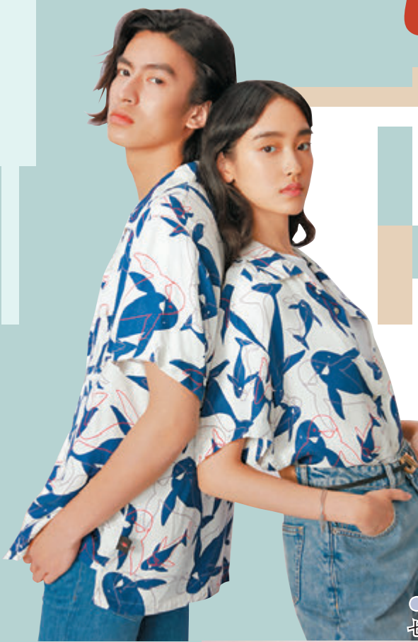
●BOSS 2021 七夕限定系列

下個月，農曆七月初七「七夕」將至，每年到這個日子，總有一種方式讓愛閃耀。這個節日起源自浪漫的中國神話，傳說中的月老會以紅線將有緣分的伴侶牽在一起，只要被紅線一牽，即使相隔千里亦會有情人終成眷屬。今年，有不少品牌特別推出七夕限定系列，當中包羅了時裝、手袋、鞋履及首飾等，讓大家在七夕情人節打造一個甜蜜浪漫的造型，或為七夕送上一份纏綿愛意之禮，與愛侶共度浪漫七夕。