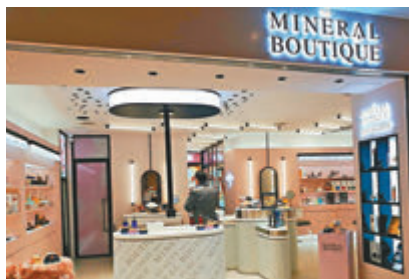
●一站式美容概念店

平日生活繁忙，不要忘記呵護肌膚，好好犒賞自己可以選擇去店內做 24K 純金面膜護膚，是將金箔與去皺修護面膜結合後，即時舒緩紅腫及撫平細紋，更能均勻膚色，他們特設能量海鹽房，在這個空間做純金面膜 Facial care 是很舒服兼很尊貴的享受。美容師還教一招，不妨於任何面霜中加入他們的 24K 純金箔粉可提升亮護膚效果，這款厚度只有 0.0001 毫米的強效金箔粉，能緊緻和撫平皺紋，重點改善血液循環和新陳代謝，令肌膚散發自然光澤。目前，他們推出的 24K 純金箔粉—亞洲限定版只需 $980。