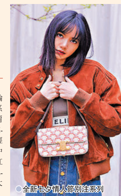
●全新七夕情人節別注系列