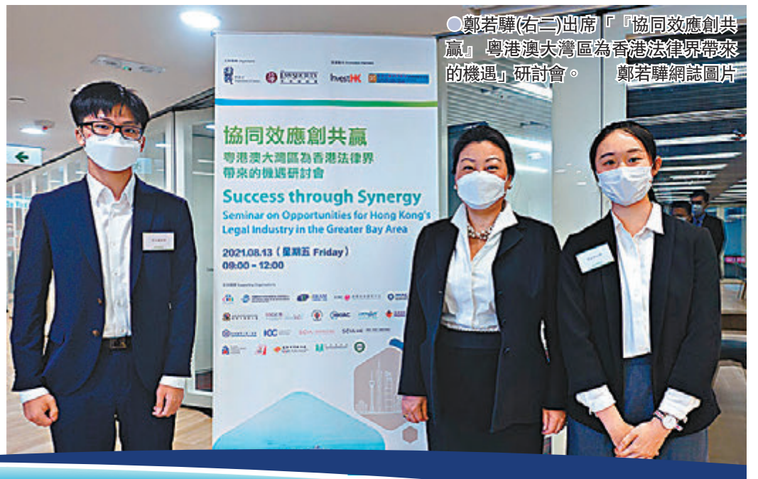
鄭若驊(右二)出席「『協同效應創共贏』粵港澳大灣區為香港法律界帶來的機遇」研討會。

粵港澳大灣區規劃為香港多個專業帶來龐大機遇。在昨日舉行的「『協同效應創共贏』粵港澳大灣區為香港法律界帶來的機遇」研討會上，香港特區政府律政司司長鄭若驊表示，香港作為中國唯一實行普通法的司法管轄區，可以在大灣區積極發揮「一國、兩制、三法域」的獨特優勢。她指出，首場粵港澳大灣區律師執業考試於上月底舉行，及格者將可在大灣區內地九市辦理適用內地法律的部分民商事法律事務，真正做到「協同效應創共贏」的效果，又透露律政司正積極尋求中央政府在深圳繼而在整個大灣區推行「港資港仲裁」，進一步吸引香港投資者到大灣區投資，及吸引外來投資者以香港作為平台到大灣區投資。鄭若驊呼籲香港法律界珍惜機會，珍惜香港律師會可以與不同的部委會面，為會員爭取發展業務的機會。 ●香港文匯報記者 唐文