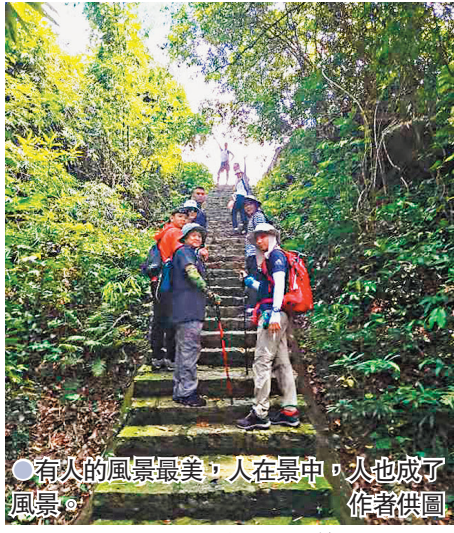
● 有人的風景最美，人在景中，人也成了風景。

話。首先映入眼帘的，是大陽台峰頂亦有一 巨石，比小陽台巨石略小。不過，小陽台巨 石上「羊台疊翠」四字是橫排草書，大陽台