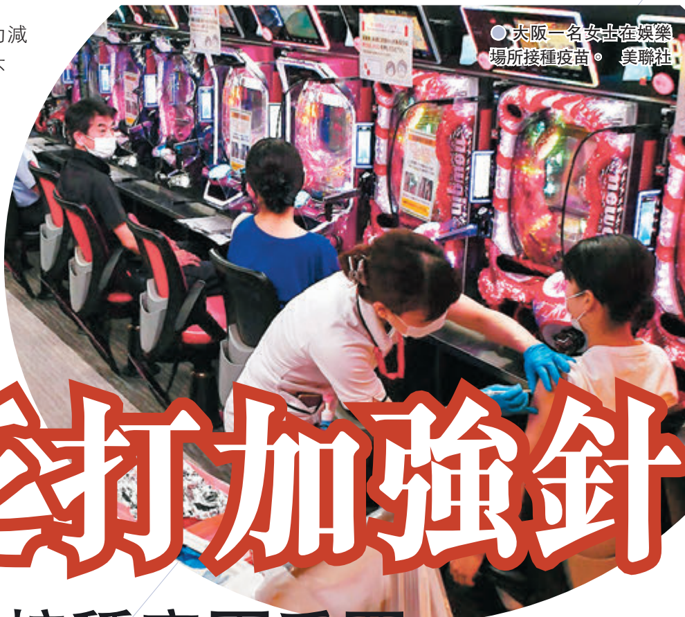
大阪一名女士在娛樂場所接種疫苗。

由於憂慮傳染力強的Delta新冠變種病毒肆虐，令疫苗效力減弱，多個國家已開始或正考慮為民眾接種第三針加強劑。不過來自全球各地的18名頂尖科學家前日在權威醫學期刊《刺針》撰文，指出完成接種新冠疫苗即可提供足夠保護力，一般民眾現階段不需要接種加強劑，認為必須有更多科學證據，證明有必要打加強針，才應廣泛推行。