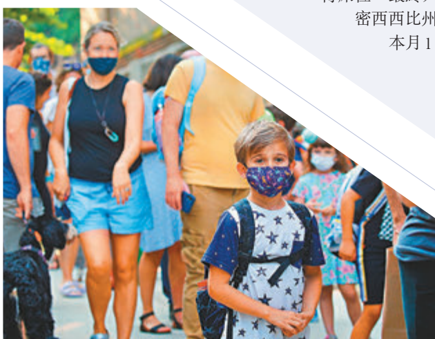
紐約學校開學。