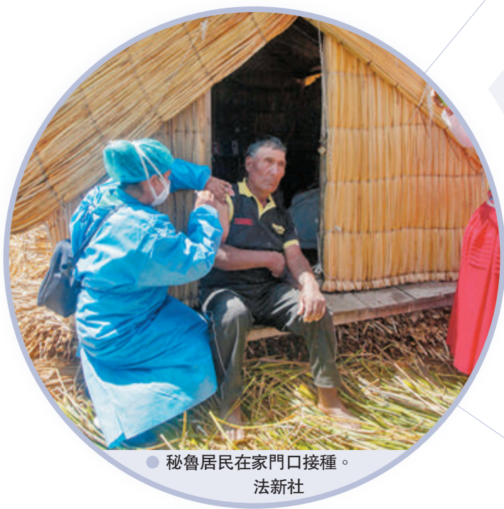
秘魯居民在家門口接種。