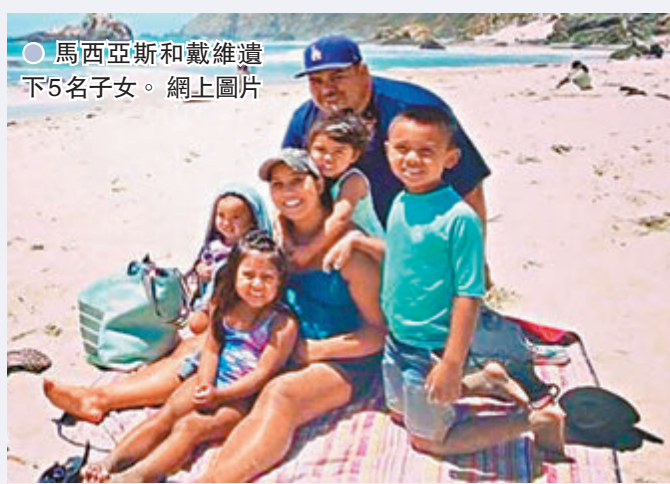
馬西亞斯和戴維遺下5名子女。