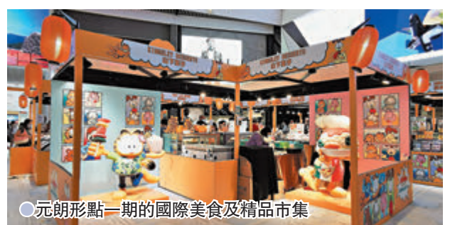
● 元朗形點一期的國際美食及精品市集

下星期二就是中秋佳節了，不少商場舉行中秋市集，其中加菲貓迷特別要注意，由即日起至9月22日，FOOD&STYLE 在元朗形點一期及二期商場一樓大堂，為