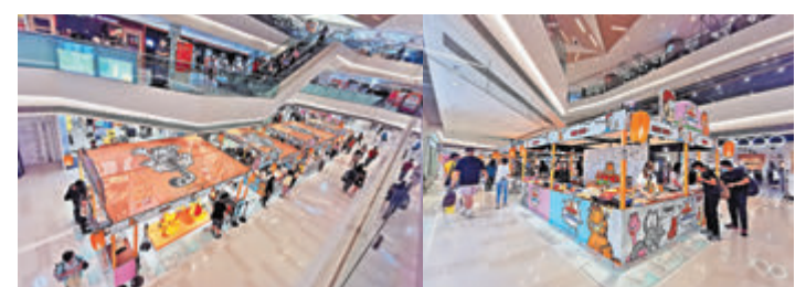
● 元朗形點二期的國際美食及精品市集