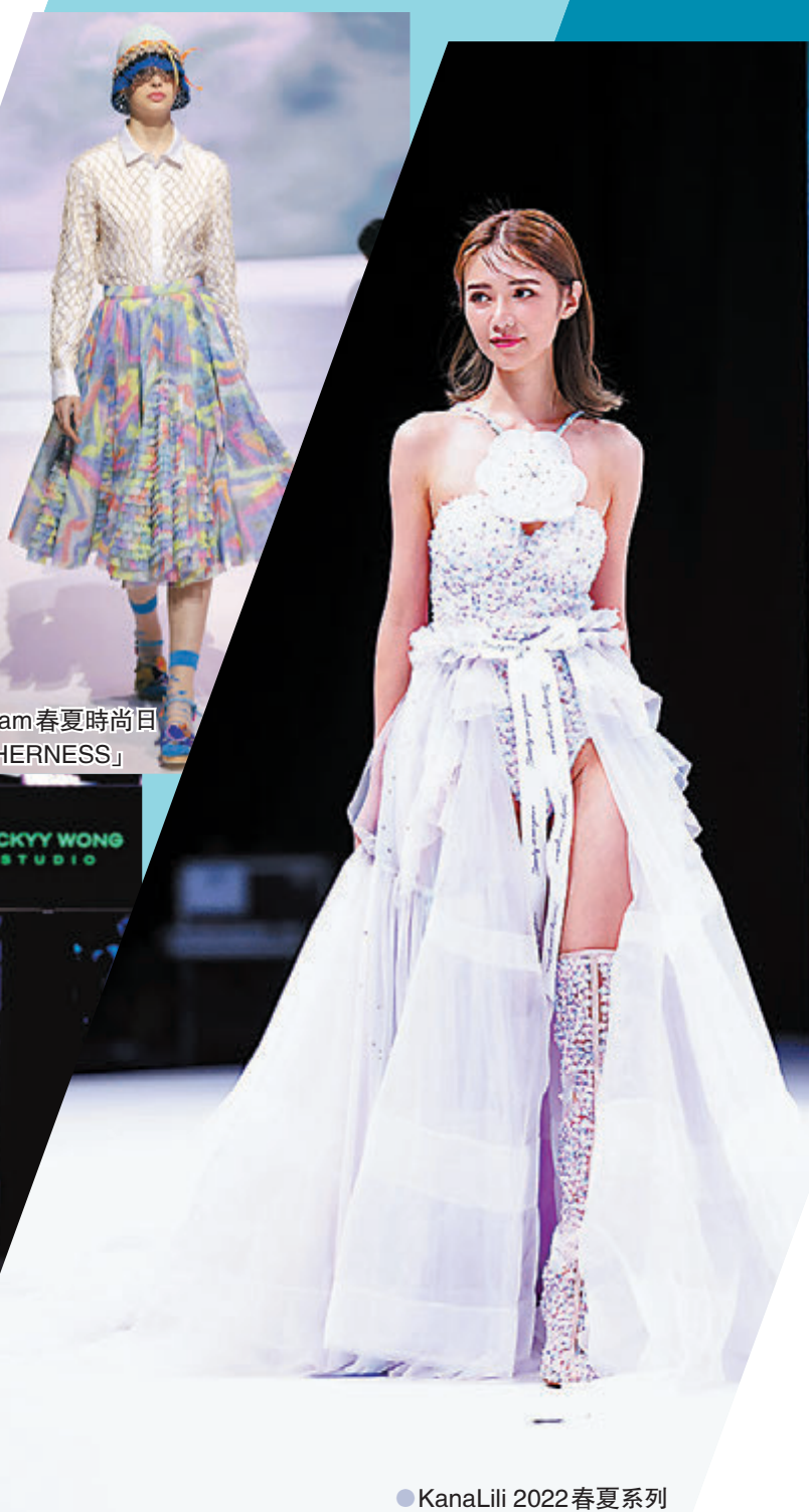
● KanaLili 2022 春夏系列