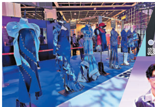
● 112 mountainyam 春夏時尚日服系列「TOGETHERNESS」

亞洲時尚盛事CENTRESTAGE (香港國際時尚匯展) 剛於上周末結束，今屆以「Chapter Infinity」為主題，寄語時裝界在後疫情時代，以創意重燃設計靈感，探索無限可能，迎接新機遇。展會雲集來自24個國家和地區共逾200個時裝品牌，呈獻最新時裝系列及時尚資訊，大會還舉辦了超過20場時裝匯演，如Hong Kong Emerging Talents Show及Fashion Go Places等，匯聚了多個香港品牌在舞台上發布其最新系列，一眾設計師衝破疫情障礙，在匯展上展現時尚創意潮流。