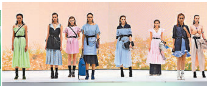
● Fashion Go Places 時裝匯演