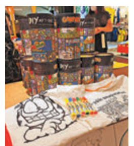
● 加菲貓 DIY T-shirt