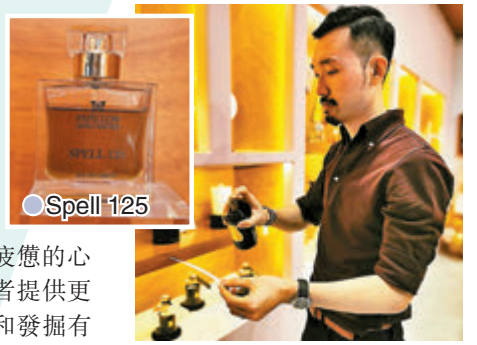
● 負責人推介小眾香水品牌。

Scented Niche 相信好的事物需要花時間創作，市面上香水選擇很多，包裝大部分也很精緻，品牌希望於這繁囂的鬧市中提供一個輕鬆的綠洲，讓香氣治癒用家疲憊的心靈，同時為香水愛好者提供更多的選擇，一同探索和發掘有個性及具原創性的香氣。早前，為慶祝開業三周年，品牌特意於尖沙咀 K11 Musca 2樓 210A 設立全新概念店，店舖設計沿用簡約的北歐風格，以素色及木質調為主調，設計簡潔、低調而奢華，中央位置擺放了亞洲首間 Trudon 訂造的香氣吧台。