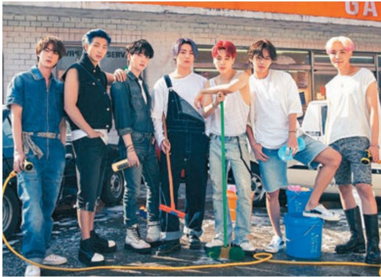
● 防彈少年團頻頻揚威國際。

據韓國青瓦台發言人朴旻美前日(13日)在記者會上透露,文在寅將於本月19日至23日訪問美國紐約及檀香山,並出席第76屆聯合國大會,防彈少年團也將以「文化特別大使」的身份隨同出席。朴旻美指出:「防彈少年團向世界傳遞了安慰和希望的信息。」