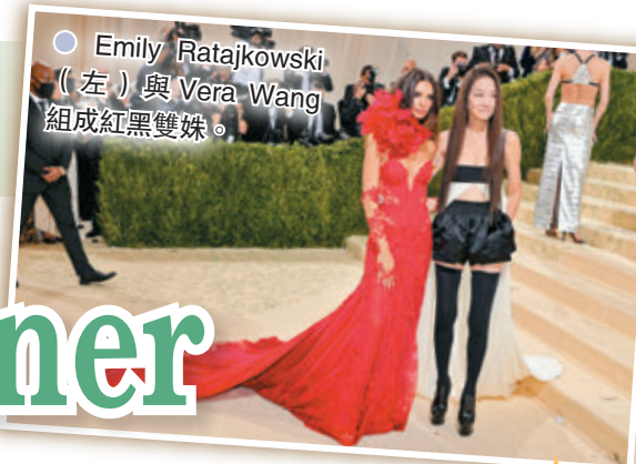
● Emily Ratajkowski(左)與Vera Wang組成紅黑雙妹。