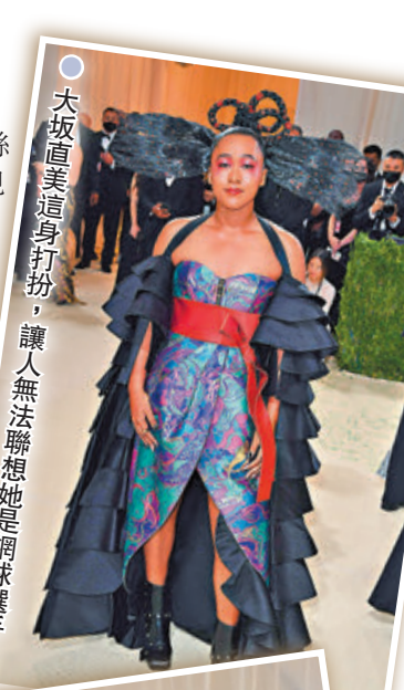
● 大坂直美這身打扮,讓人無法聯想她是網球選手。