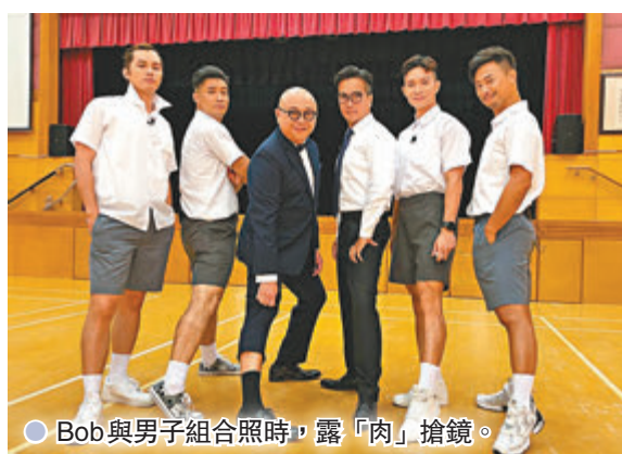
● Bob與男子組合合照時,「露肉」搶鏡。