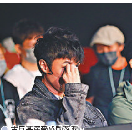
● 古巨基深受感動落淚。