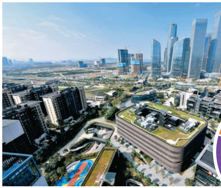
●前海方案及理財通進一步深化了內地與香港金融市場的互聯互通，許多深圳港資金融機構對此十分歡迎。