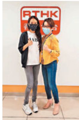
●莫文蔚指近年香港樂壇變得活潑多了。

「華語樂壇天后」Karen終於鳥倦知還回到香港這個老家，她說全世界跑了這麼多的地方，發覺自己還是最愛香港！其實，香港人也最愛她啊！