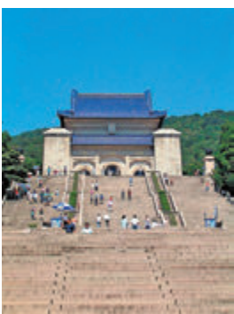
●南京紫金山南麓的中山陵，氣勢宏偉。

整個建築群依山勢、由南往北沿中軸線層層升高，氣勢宏偉。陵園的入口牌坊，刻着孫中山手書的「博愛」二字，也是他生前座右銘，到達陵門，又見牌匾刻着孫中山另一個理念「天下為公」。進入陵門之後，迎面是一座碑亭，巨碑的正面刻有國民黨元老譚延闓手書的「中國國民黨總理孫先生於此中華民國18年6月1日」24個鎏金大字。拾級而上392個台階，終登上平台，祭堂矗立在前——祭堂大門上方是孫中山手書的「天地正氣」4個大字，以及3道拱門上分別刻有「民族」、「民生」、「民權」6個篆書大字，代表着其創立的三民主義。