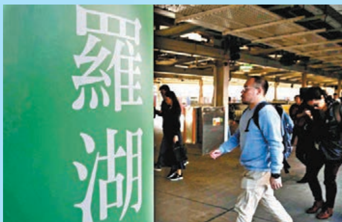
● 深港東部快軌擬自深圳坪山站引出後，連接港鐵羅湖站。 資料圖片

香港文匯報訊（記者 郭若溪 深圳報道）繼「港深西部快軌」後，深港兩地間將再增一條快軌線路，進一步加強交通互聯互通。近日，深圳市交通運輸局發布了《坪山區綜合交通「十四五」規劃》（以下簡稱《規劃》），首次公開披露正在謀劃建設「深港東部快軌」，《規劃》稱，深港東部快軌旨在加強深港東部科技軸線發展，強化香港對粵東北地區的輻射帶動。