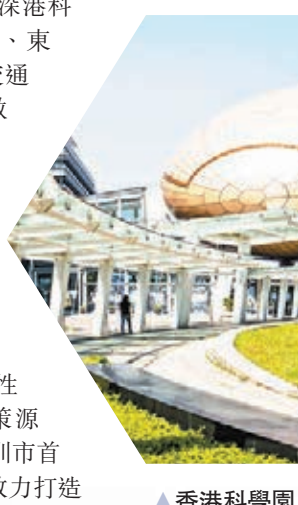
▲ 香港科學園 資料圖片

根據綱要的具體規劃，大運深港國際科教城的定位涉及「深港創新合作新樣板、綜合性國家科學中心的創新高地和策源地」，阿波羅未來產業城是深圳市首批7個未來產業集聚區之一，致力打造