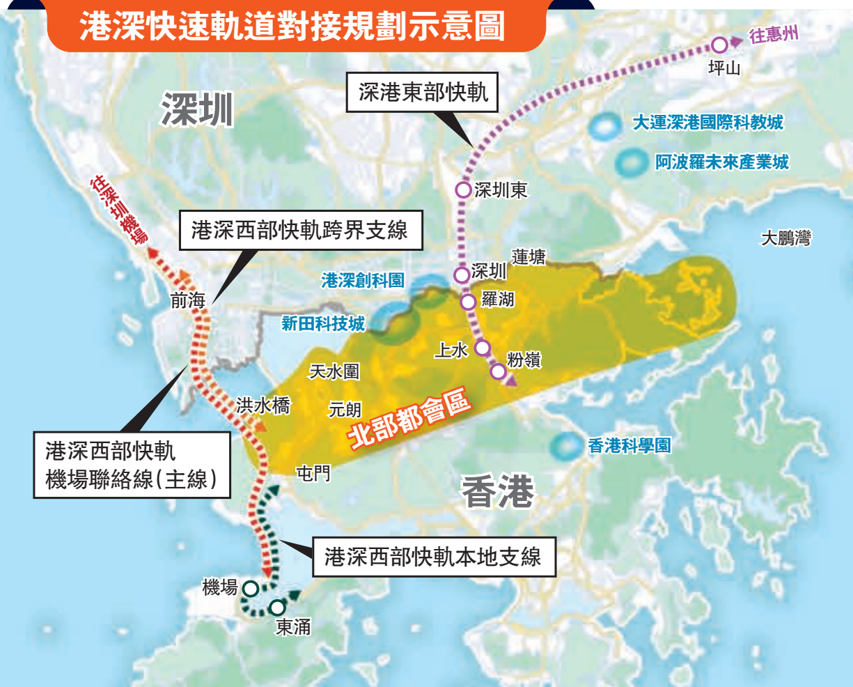
港深快速軌道對接規劃示意圖

香港文匯報訊（記者 郭若溪 深圳報道）繼「港深西部快軌」後，深港兩地間將再增一條快軌線路，進一步加強交通互聯互通。近日，深圳市交通運輸局發布了《坪山區綜合交通「十四五」規劃》（以下簡稱《規劃》），首次公開披露正在謀劃建設「深港東部快軌」，《規劃》稱，深港東部快軌旨在加強深港東部科技軸線發展，強化香港對粵東北地區的輻射帶動。