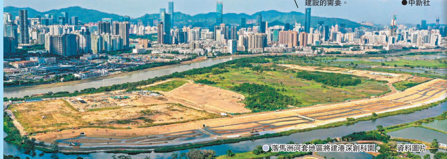
● 落馬洲河套地區將建港深創科園。 資料圖片

據了解，坪山區擁有全國首批、深圳唯一的國家生物產業基地，集聚了以賽諾菲巴斯德、國藥致君、理邦精密等行業領軍企業為代表的一批生物醫藥企業和以深圳灣實驗室坪山生物醫藥研發轉化中心、蒙納士科技轉化研究院為代表的一批創新平台。此外，坪山高新區已成為國內新能源汽車產業鏈最完善的產業區，新能源產業已經形成了較為完整的產業鏈和產業集群，匯集了比亞迪、開沃、新宙邦、巴斯巴、沃爾斯新能源等企業。