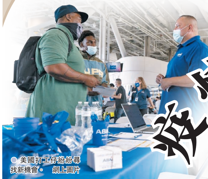
●美國打工仔紛紛尋找新機會。