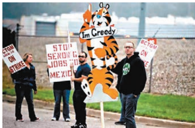
●家樂氏員工罷工抗議待遇惡劣。網上圖片