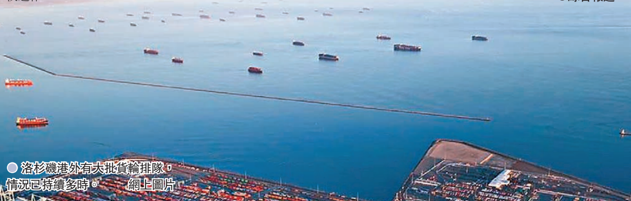
●洛杉磯港外有大批貨輪排隊，情況已持續多時。

美國總統拜登昨日召開會議，商討處理供應鏈問題，白宮高層官員則在會前透露，兩個加州港口將24小時運作，此外沃爾瑪、UPS及聯邦快遞3間公司，都準備全天候運作。