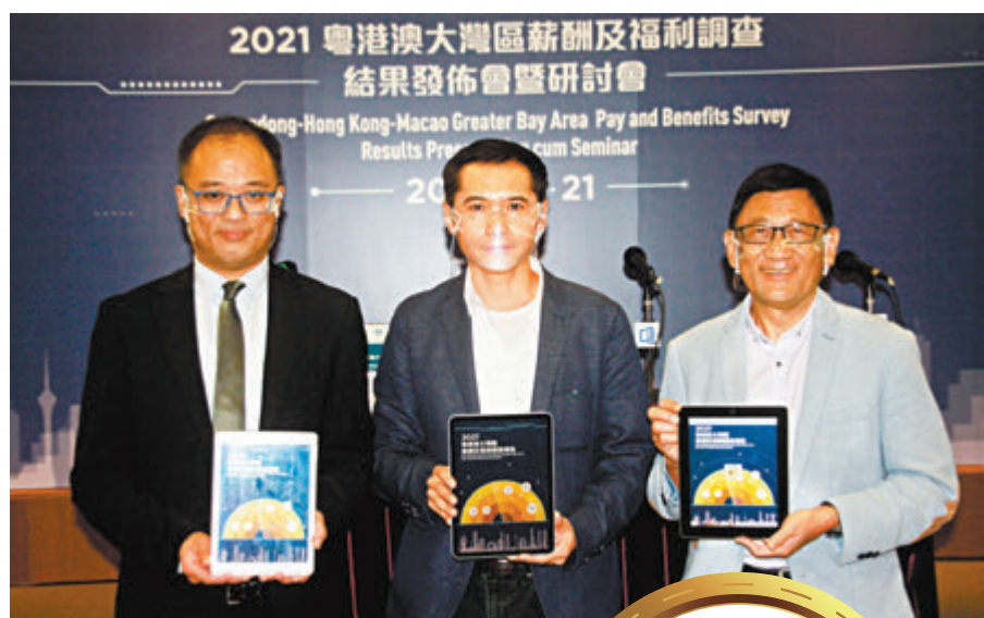
●「2021 粵港澳大灣區薪酬及福利調查」結果，按職級預測香港打工仔明年度(2021/22年度)獲加薪1.9%至2.4%。

香港新冠疫情漸趨穩定，打工仔均期望最難捱的日子已經過去，並獲加薪享受經濟復甦的成果。香港浸會大學工商管理學院人力資源策略及發展研究中心、香港人才管理協會等機構昨日公布「2021 粵港澳大灣區薪酬及福利調查」結果，按職級預測香港打工仔明年度(2021/22年度)獲加薪1.9%至2.4%，稍高於本年度的1.3%至2.1%，但仍遠低於大灣區廣東省其他城市的5.3%至5.8%。此外廣東省城市的應屆畢業生起薪點雖然比香港低一截，但調查機構指近年內地發展迅速、機遇處處，在內地工作的跳薪及晉升速度較香港快，大學畢業生最快3年至5年晉升為經理級職位，或較香港快一倍，呼籲港青放眼內地的發展機遇。