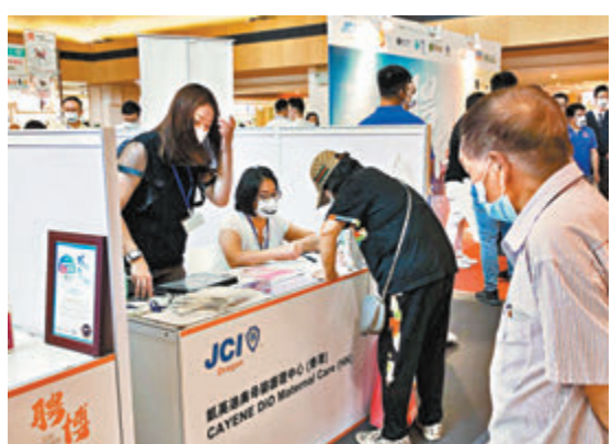
●勞工處將於下月舉辦「中高齡就業新里程招聘會」。圖為香港一招聘會現場。