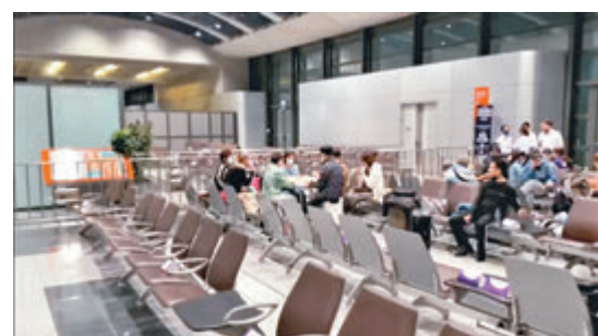
●大批郵輪乘客滯留碼頭。

香港文匯報訊（記者 文森）皇家加勒比國際遊輪旗下的「海洋光譜號」原定昨晚出發的公海遊航程，因一名船員檢測初步確需要即時送往隔離，約千名旅客的行程告吹之餘，昨午一度滯留在啟德郵輪碼頭。船公司表示，會為受影響乘客提供多重補償方案，包括全額退回已支付的船費和港務稅費、交通費補貼與代用券等。另外，有消息指該船員疑為復陽個案。