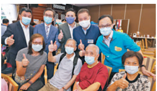
●聶德權到場鼓勵市民接種新冠疫苗。

在當區活動，要跨區到社區疫苗中心接種非常困難，知道昨日有專線車接載後，決定搭「順風車」打針，亦有長者希望接種後可盡快回內地。