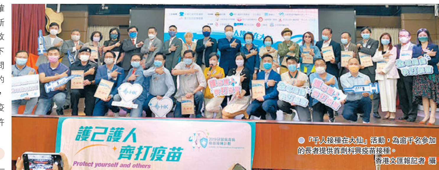
●「千人接種在大仙」活動，為逾千名參加的長者提供首劑科興疫苗接種。

他表示，兩款供港疫苗都有效，但第三針選用復必泰，是因其對Delta變種病毒保護力較科興強，產生中和抗體的表