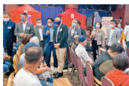
●徐英偉昨日到場探望，並呼籲未接種疫苗的長者盡快參加。

愛心全達慈善基金是活動協辦團體之一，董事兼活動召集人黃業坤在接受香港文匯報訪問時表示，今次安排近80位長者前來接種疫苗，當中有80歲以上的長者，認為有駐場醫生為大家作身體狀況評估，相信大家能夠安心接種。 執行主席潘伯傑亦說，科學證明長者接種疫苗後能夠提高免疫力，並降低感染率，為自己和家人提供安全保障。如果香港達至全民接種，能為香港築起免疫屏障，早日達成正常通關目標。 「千人接種在大仙」活動今日（22