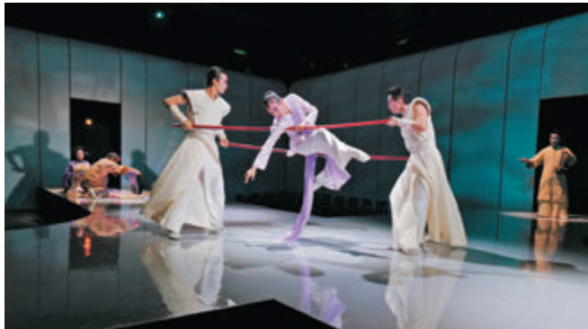
▲ 《紫玉成煙》結合簡約粵劇與舞蹈劇場。

紫色絲帶的金印，比喻高官厚祿。紫綬袍既是小玉據理爭夫的特定符號服飾，也是「正名」自身為高門女眷之意。天橋上特別看得清楚，素臉小玉穿着紫綬袍步上天橋，在橋上一隅讓美妝師替她畫上粵劇旦妝容。這是整裝待發，以服飾明志。看似戲劇化「戴上粵劇面譜」的堅強小玉，最後死在蒙面武士懷中。似是奸角的黑武士，竟然不是盧太尉，而是十郎李益的臉。傳統粵劇中逼婚的太尉與心志不堅的十郎，原是同謀共犯。在男權社會的世界裏，我們沒有人是無辜的。