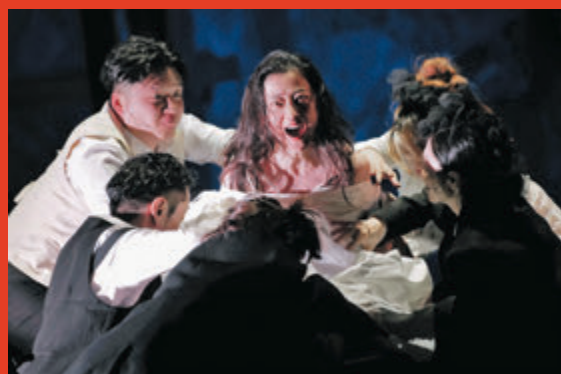
▲ 孟京輝版《紅與黑》在烏鎮戲劇節上演。