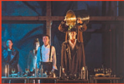
● 《紅與黑》中的「孟式飯桌」。