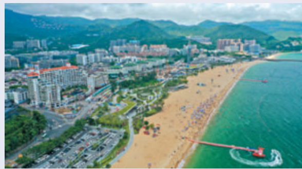
●沙頭角將建深港國際旅遊消費合作區。圖為深圳鹽田海濱棧道。資料圖片

根據深圳市方面的規劃，沙頭角深港國際旅遊消費合作區也是深港口岸經濟帶重點建設的片區之一。香港文匯報記者從深圳市鹽田區了解到，鹽田區已經明確將加