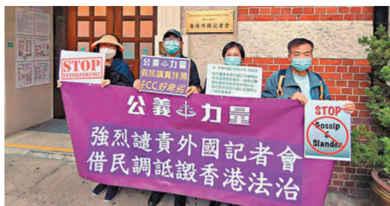
●「公義力量」批評FCC假借所謂「民調」詆毀香港法治。