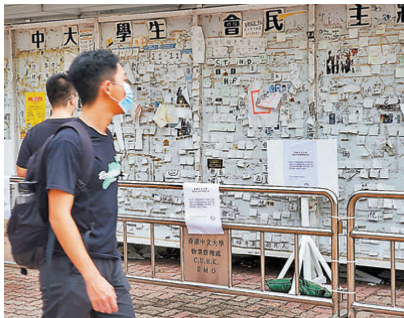
●中大學生會外的「民主牆」於上月被圍封。

發言人表示，自學生會上月7日宣布解散後，校方一直與各學生代表緊密溝通，單在過去一個月已舉行了五次會面，與逾百名負責營運不同學生組織的學生代表交代及討論跟進安排。在具廣泛代表性的新學