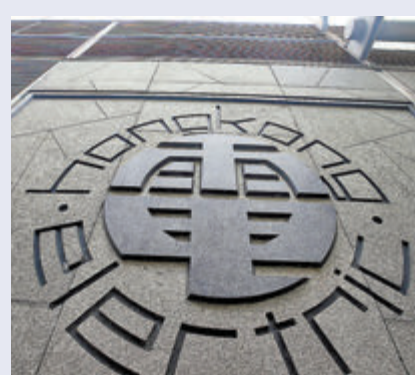
●據了解，中電（圖左）及港燈（圖右）最快今日公布來年電費的調整幅度。

香港文匯報訊（記者 文森）受全球能源供應短缺影響，中電及港燈的燃料附加費近月不斷上升。據了解，兩電最快今日（9日）公布來年電費調整幅度，預計加電費的機會相當高。而根據兩電於2018年的預測，中電及港燈明年淨電費分別達1,365元及1,446元，若按現時淨電費計算方程式，兩電或加價逾一成。