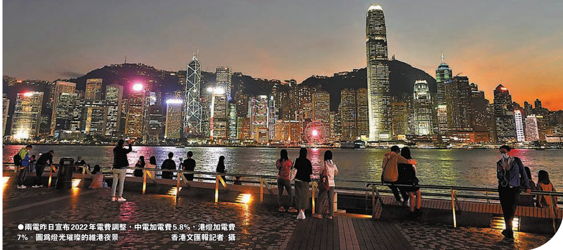
●兩電昨日宣布2022年電費調整，中電加電費5.8%，港燈加電費7%。圖為燈光璀璨的維港夜景。

國際燃料價格不斷飆升，香港也在疫下狂加電費。中電及港燈昨日公布明年的電費調整方案，雖已凍結基本電價並提供特別回扣，但中電及港燈的平均淨電費仍分別加5.8%及7%，明年1月1日起生效。特區政府環境局局長黃錦星昨日表示，以一個3人家庭作估算，現時平均每月用電量為275度電，加電費後每月需多付約20元至24元。由於特區政府提供的電費補貼將於明年中陸續完結，3人家庭無政府補貼後，將要交多100元電費，較目前水平飆升28%至40%。