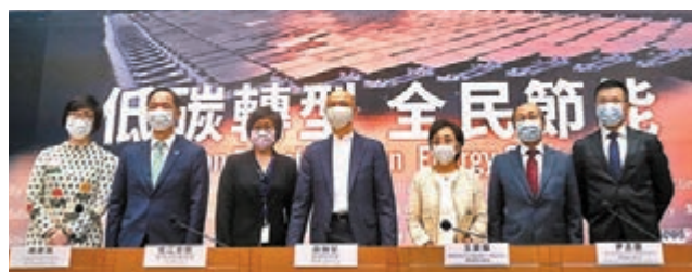
●環境局與港燈、中電昨日舉行2022年電費調整記者會。

環境局昨日聯同中電及港燈舉行記者會公布明年電費調整方案。中電將凍結基本電價，但燃料調整費將上調10.5仙至每度電38.6仙，並同時會發放兩項回扣，包括每度電2.1仙的特別回扣，以及每度電1.3仙的地租及差餉特別回扣。經調整後，明年平均淨電費為每度電128.9仙，上調約5.8%。港燈增加燃料調整費至每度電27.3仙，基本電費則維持不變，並提供每度電1仙的特別回扣，令每度淨電費增加8.9仙，加幅為7%。