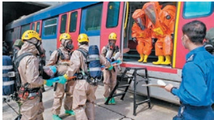
●警方、消防及港鐵昨日舉行代號「高壘」的跨部門化生輻核反恐演習。

根據《條例》第27A條，任何人進行公開活動，煽惑另一人在選舉中不投票，即屬在選舉中作出非法行為，一經定罪最高可判處監禁3年及罰款20萬元。廉署強調必定會嚴正執法，打擊操控或破壞選舉的行為，又呼籲市民嚴守法規，切勿參與不法呼籲或轉載相關違法內容，共同維護選舉廉潔公平。