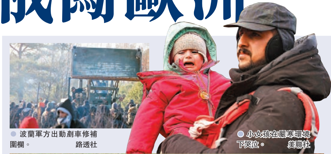
●波蘭軍方出動剷車修補圍欄。