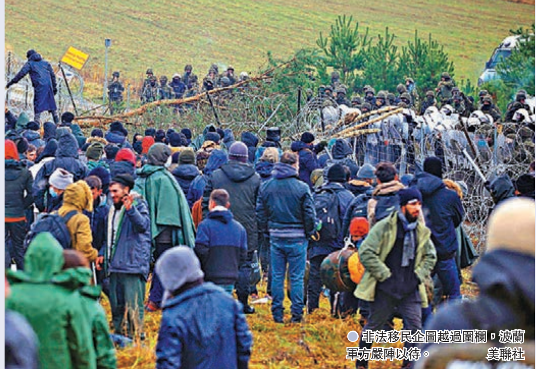
●非法移民企圖越過圍欄，波蘭軍方嚴陣以待。