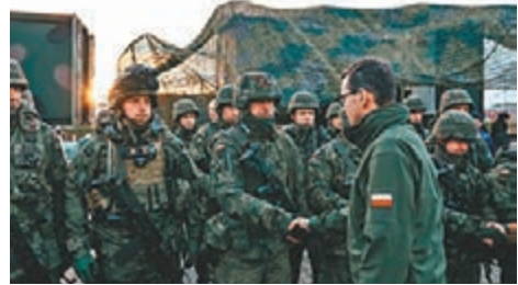
●波蘭總理莫拉維茨基(前)到前線探訪軍隊。