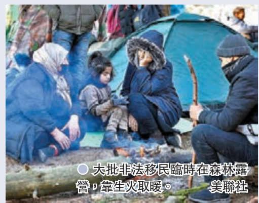
●大批非法移民臨時在森林露宿，靠生火取暖。