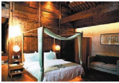
● 民宿的客房設計古樸典雅。