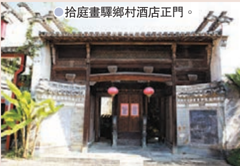
● 拾庭畫驛鄉村酒店正門。