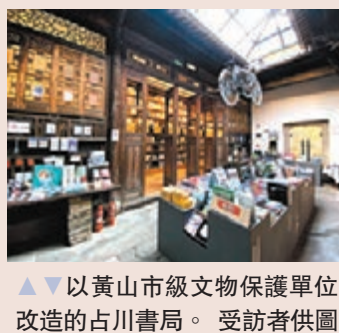
▲▼ 以黃山市級文物保護單位改造的古川書局。

坐在文物古建裏喝茶、看書、參加藝術展，左手雕樑畫棟，右手梵高藝術，所謂古今融合，中西合璧，亦不過如此。2020年，有着近300年歷史的黃山市級文物保護單位，同時也是黃山市區範圍內規模最大的古建「石家大院」，經過黃山文化旅游發展股份有限公司的全新修繕、改造後，以「古川書局」身份全新亮相。「古川書局」集展覽、書店、咖啡館、客棧等功能於一體，其百年沉澱的徽派文化魅力搭配現代複合式文化體驗，讓它成了「黎陽in巷」商業街區的活招牌，不僅吸引了外地遊客打卡，本地居民亦經常光顧。