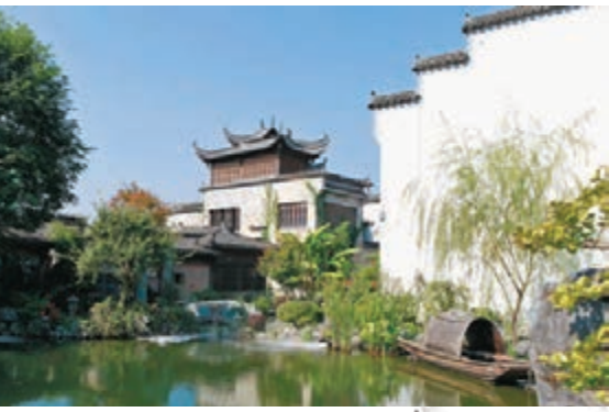
● 拾庭畫驛民宿內的園林景觀。