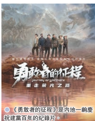
● 《勇敢者的征程》是內地一齣慶祝建黨百年的紀錄片。

製作方負責人說，五處險境，五個重要時刻，五個英勇拚搏的故事，是大家站在新時代對中國革命歷史的回望，更是不忘初心、重溫前輩崇高理想信念的視覺體驗。