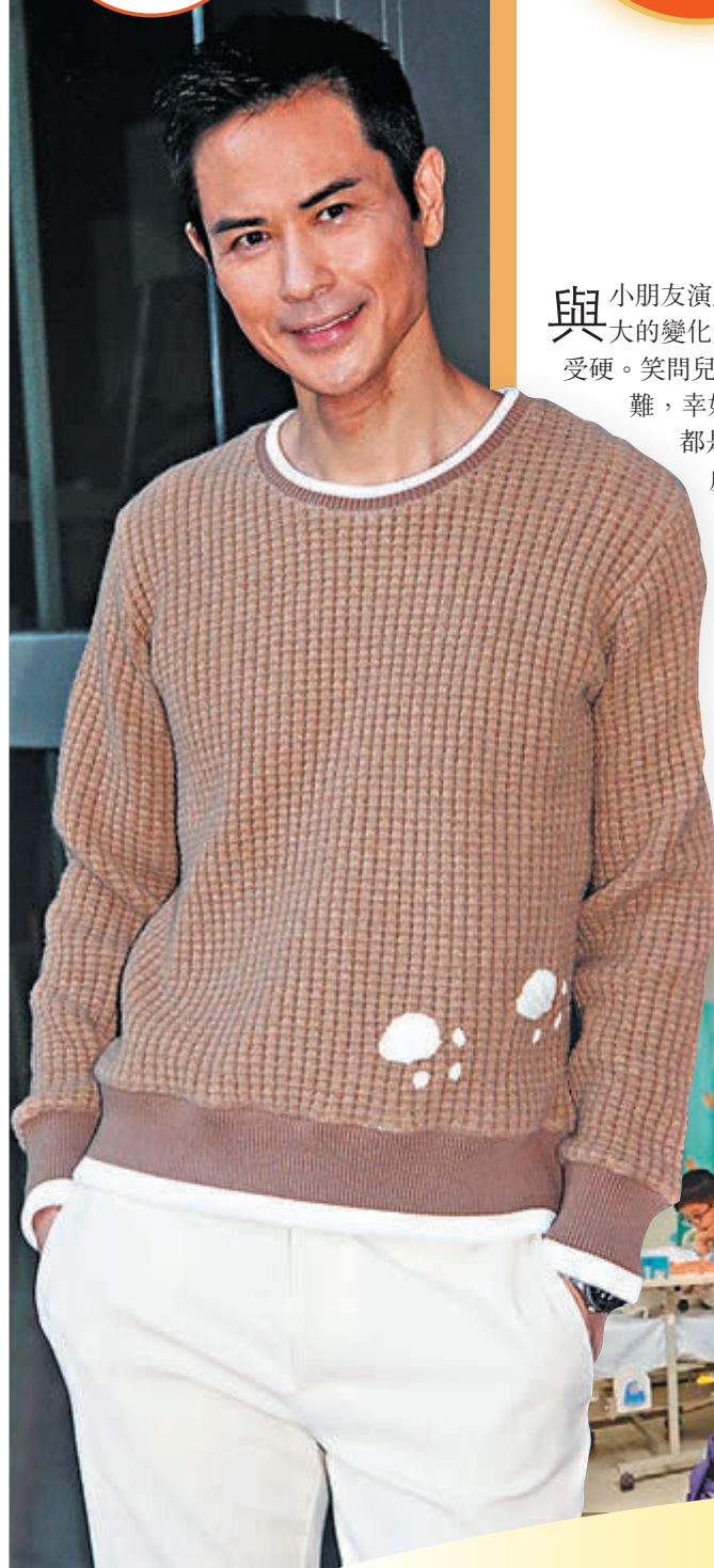
服裝：Lane Crawford

與小朋友演戲是公認的大難題，嘉穎稱拍完此劇後自己最大的變化是訓練到耐性，因為大部分小朋友都是受軟不受硬。笑問兒子還是太太陳凱琳難應付，嘉穎說：「各有各難，幸好太太不是一個難搞的人。之前說要重振父威都是沒用的，我覺得跟小朋友好像朋友一樣相處，要跟他們講道理，當然太難講的就要制止，但我也不能打。」嘉穎稱大仔個性比較硬頭，很多事情要慢慢跟他溝通，但他聽不聽進耳就要看心情，但作為父母就要盡責去教。