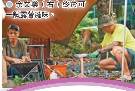
● 余文樂(右)終於可一試露營滋味。