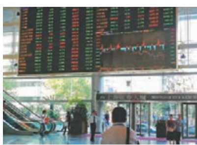
●滬指昨收報3,507點，漲8點。

昨日A股上升的板塊中，軍工股升幅居前，航天航空板塊拉升3%。中信證券指出，「十四五」期間，軍工行業核心投資邏輯的切換，已經從前期的「主題投資」轉向「基本面驅動」為主導，預計2022年軍工行業的景氣度將向「十四五」的正常增速回歸，進入「新常態」，建議選擇長賽道和高景氣方向，優先推薦航空發動機、軍隊信息化以及軍工新材料三個細分產業方向。