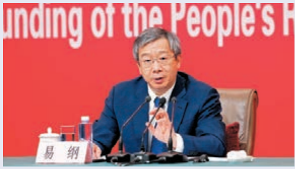
●易綱表示，數字人民幣利率為零，以減少和銀行在存款上的競爭。 資料圖片

香港文匯報訊 人民銀行行長易綱昨日表示，高度重視數字人民幣個人信息保護問題，數字人民幣交易中的信息收集遵循最小化和必要性原則。除非法律另有規定，否則央行不得將信息交給第三方或其他政府機構。他又表示，數字人民幣利率為零，以減少和銀行在存款上的競爭。