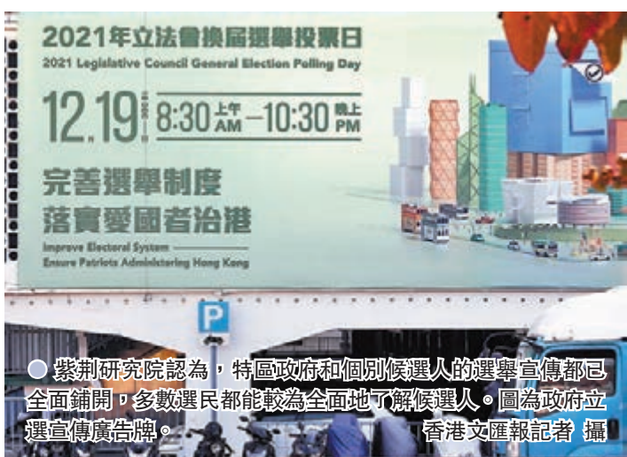
紫荊研究院認為，特區政府和個別候選人的選舉宣傳都已全面鋪開，多數選民都能較為全面地了解候選人。圖為政府立法選舉宣傳牌。

受冷待。在調查給出的9個議題選項中，支持度最高的3個議題均為民生類議題，包括推動全民退保（75.6%）、改善公營醫療（73.4%）、公眾地方全禁煙（72.5%）。結果反映，大多數市民期待新一屆立法會議員當選後，當務之急是處理事關廣大市民福祉的民生議題，增進市民幸福感、獲得感。