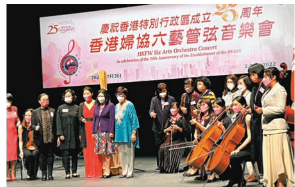
◆林麗嬋（紫色外套）出席活動。

香港文匯報訊 香港特區行政長官李家超太太林麗嬋昨日低調出席香港各界婦女聯合總會舉辦的「慶祝香港特別行政區成立25周年——香港婦協六藝管弦音樂會」活動，這是李家超上任後，林麗嬋作為行政長官夫人出席的首個社會活動。李家超與太太林麗嬋在中學聯誼舞會認識，並於1980年結婚。兩人的婚姻至今已穩固維持了42年之久，育有兩名兒子。李家超與太太感情甚篤，曾在宣誓就職當天（7月1日）於社交平台發文，特意感謝太太多年來照顧家庭，又指未來五年更需要對方的扶助，讓他全情投入為香港每個家庭的幸福努力。