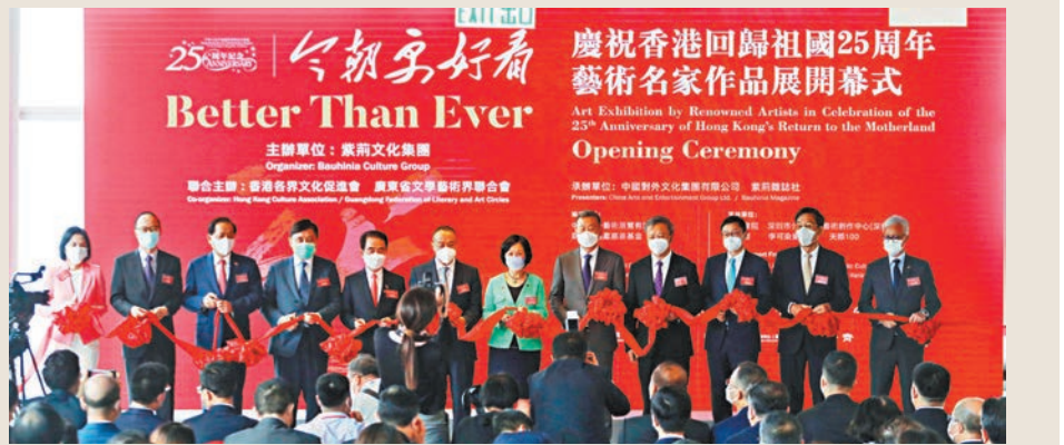
◆「今朝更好看——慶祝香港回歸祖國25周年藝術家作品展」開幕式昨日上午在天際100舉辦，共展出20多位藝術大師共70多件藝術精品。

兩制」方針的正確指引下，實現了長期繁榮穩定，為祖國創造經濟長期平穩快速發展的奇跡作出了不可替代的貢獻。今天，我們和香港同胞一道邁向中華民族偉大復興的壯闊征程，中華兒女眾志成城，共踏復興之路，共享偉大榮光，聚力描繪「今朝更好看」的壯麗風景。今後，紫荊文化集團還將與香港廣大文化藝術界同仁一道搭建更大平台、舉辦更多活動，增進祖國內地與香港文化領域的交流合作，助力香港發展成為