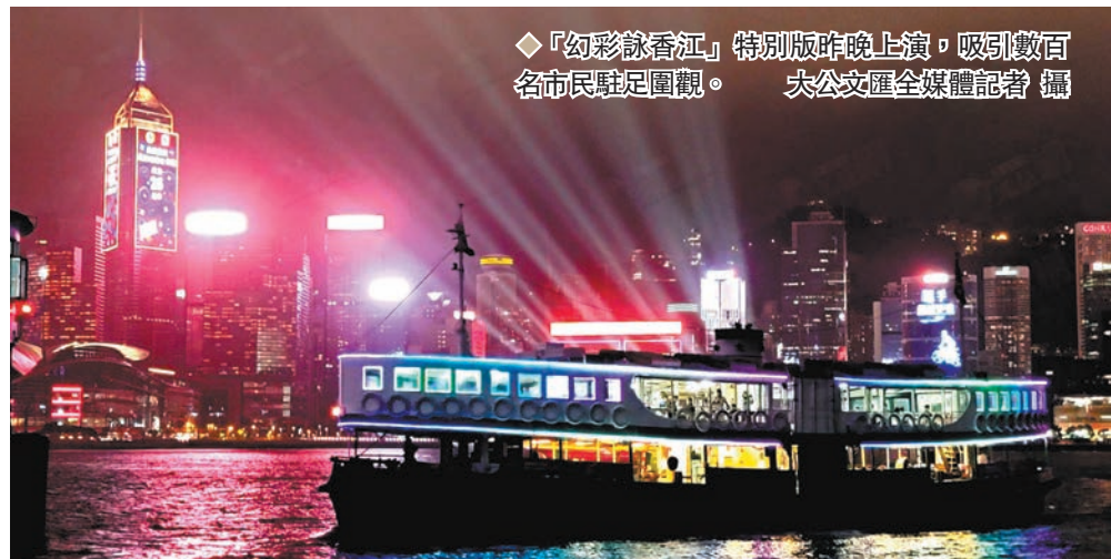
◆「幻彩詠香江」特別版昨晚上演，吸引數百名市民駐足圍觀。

香港文匯報訊 「幻彩詠香江」特別版「維港光影匯演」於昨晚8時上演。大公文匯全媒體記者晚上8時到達尖沙咀海濱，現場已有數百名市民等候觀賞這場夢幻光影秀。不少市民在天台觀看並設置腳架及相機，拍攝整個表演。