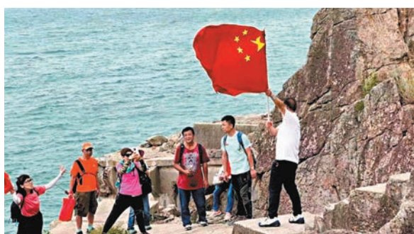
◆西灣炮台有行山市民揮舞國旗拍照。