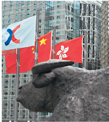
◆專家認為，港股成交回升將是指數見底信號。

此外，金管局上周六再度入市捍衛港元，承接來自市場的25.91億元沽盤。隨着金管局入市，本周二銀行體系結餘將縮減至1,040.14億元。