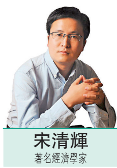
宋清輝 著名經濟學家