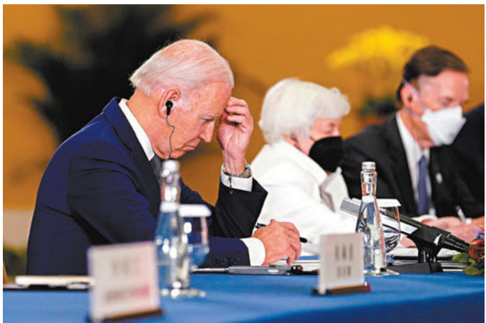
◆拜登總統專注傾聽，不時低頭記錄。