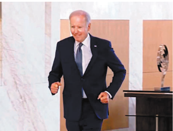
◆當拜登總統看到和習近平主席還有段距離，微笑着用開臂膀跑了幾步，現場記者一片驚嘆。