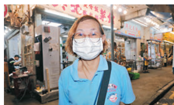
◆陳女士預計降溫後生意增加兩三成。

陳女士在油麻地經營的煲仔飯店已有近50年歷史，在知道降溫的消息後，提前準備很多食材，「天氣變凍肯定更多人來食煲仔飯，已經入定貨啦」，惟昨晚氣溫仍較溫暖，光顧陳女士店舖的客人未有明顯增加，「溫度今晚（指昨晚）不降，明天（即今天）亦會降，提前準備好食材不會有錯，預計溫度下降後生意增加兩至三成。」