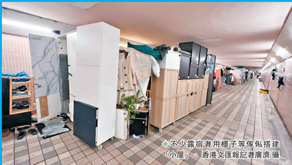
◆不少露宿者用櫃子等傢俬搭建「小屋」。