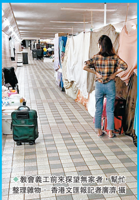
◆教會義工前來探望無家者，幫忙整理雜物。