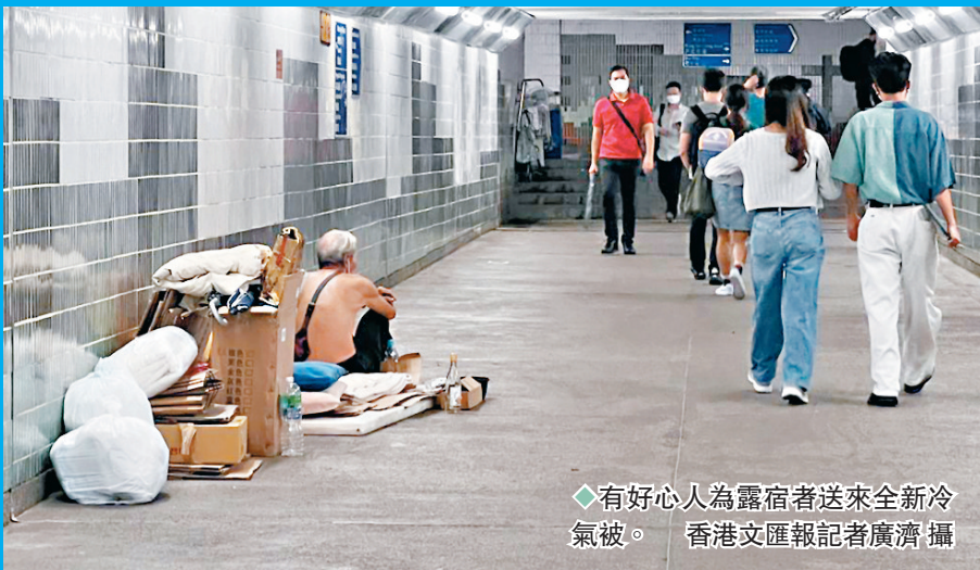
◆有好心人為露宿者送來全新冷氣被。