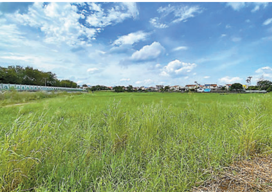
元朗攸壆路(伯特利中學旁)