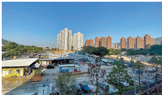
屯門第54區(欣寶路附近，毗鄰紫田村及欣田村)