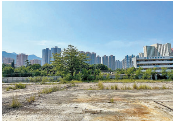
屯門第3A區(輕鐵青松站旁)