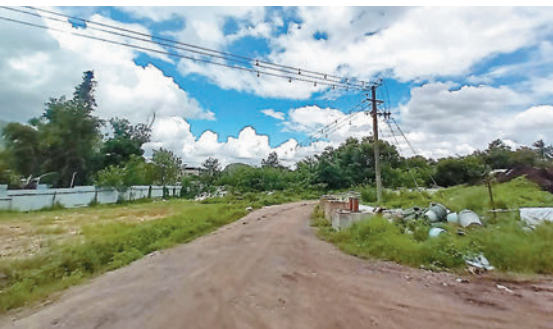
上水蓮塘尾(鄰近邁爾豪園)