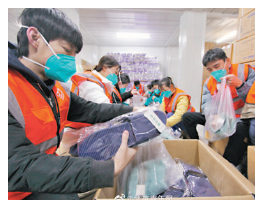
◆在北京新國展方艙醫院物資庫房，工作人員正在分裝生活用品。

不過，有快遞外賣小哥反映由於小區封閉管理他們回不去家。北京朝陽區副區長孟銳11月29日對此表示，針對一部分快遞外賣小哥因小區封閉管理回不去家的問題，朝陽區在望京、勁松、雙井、香河園等快遞外賣小哥比較集中的區域，建立首批「有家驛站」，為快遞外賣人員提供臨時住處。