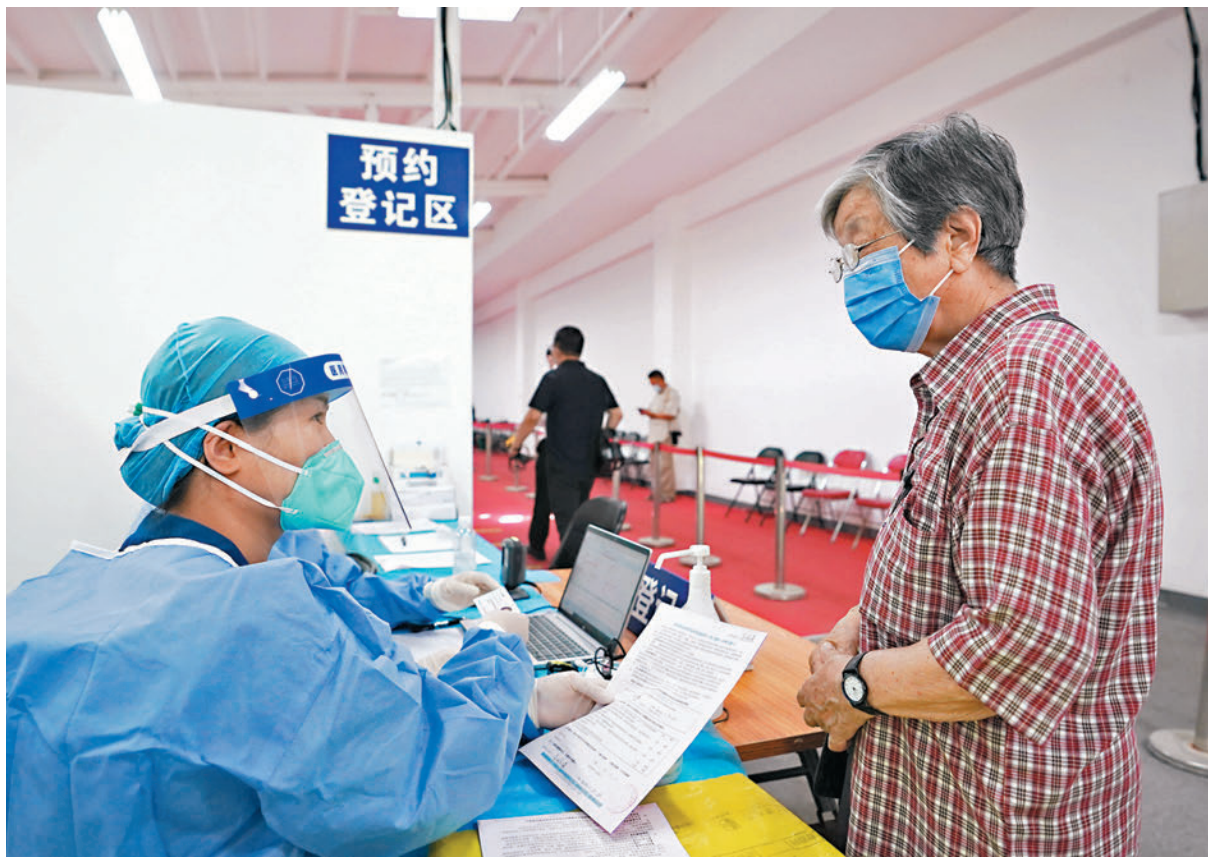
◆早前在北京市朝陽區一處新冠疫苗接種點，工作人員（左）為一位接種新冠疫苗加強針的86歲市民登記信息。資料圖片

郭燕紅強調，接種疫苗可以有效降低重症和死亡風險，建議沒有禁忌症、符合接種條件的人群，特別是老年人，應當盡快接種新冠疫苗，符合加強接種條件的要盡快加強接種。