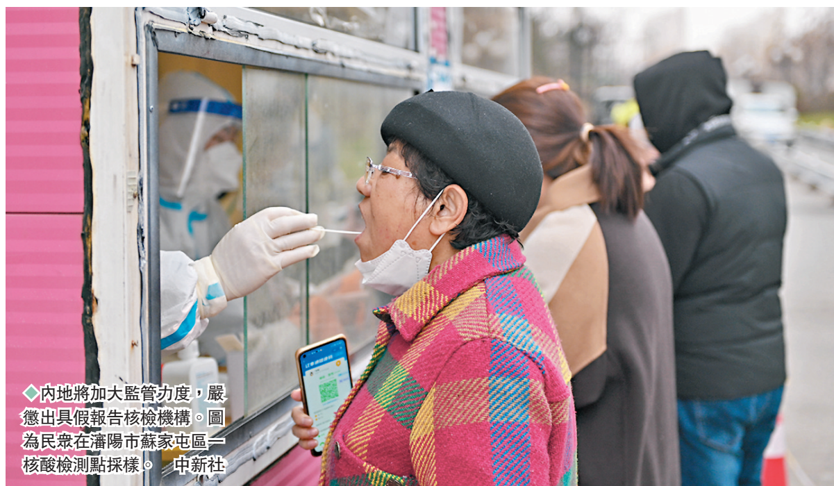
◆內地將加大監管力度，嚴懲出具假報告核檢機構。圖為民眾在瀋陽市蘇家屯區核酸檢測點採樣。中新社

樸石醫學早前還因涉勞資糾紛被北京房山區勞動人事爭議仲裁委員會作出償付裁決。惟在今年8月23日，事主在向法院申請強制執行並獲立案後，房山法院通過全國網絡查控系統及北京法院執行辦案系統查詢被執行人名下財產發現，樸石醫學已無可供執行財產。房山法院遂就此作出終結執行的裁定。