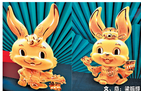
今年係我哋嘅兔年，同我整返幾句兔年吉祥語，我要成語個隻！有冇難度啫！