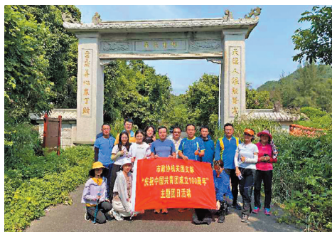
◆團支部到西貢和半天雲開展主題團日活動。

西貢村坐西朝東，背靠紅花嶺，村前有西貢河經過，流入著名的西涌海灘。往北數里有南社村，往南則是茫茫大海。從西貢村往西進入叢林，翻越紅花嶺和拋狗嶺到半天雲村，是一條長約10公里的古道。