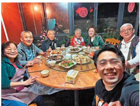
◆媽媽在哪裏，哪裏便是家！

山清水秀，他又落足心機去設計，開關了一個又一個的風景怡人的休閒和學習的區域。 因為通關了，因為可以自由活動，葉教授認為是時候回來，且是春節的好日子，得回來見兒老媽和親朋好友，另一個目的是回來吃、吃、吃！ 他回來幾天了吧，天天到處吃，那是他的嗜好，一天可以食五六餐不同國家的菜式。我問他兩年沒有回來，有什麼感覺？ 他很直接地說，在惠州兩年，回來有點不習慣，香港的家細，空氣質素很不好，已經動了返惠州的念頭，不過香港這麼細卻有吃遍世界各地的美食，確是美食之都！ 兩位朋友都有不同的體會，但心中所念的還是那一份情，對家的那一份情！