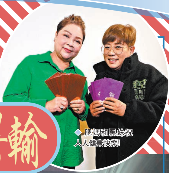
肥媽和黑妹祝人人健康快樂！