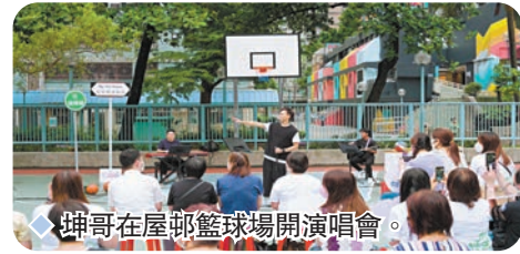
坤哥在屋邨籃球場開演唱會。