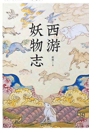
《西遊記》中的妖怪，玉兔精被視為弱者。

打不過就逃，為免受戮，就逃，就想辦法的逃，這是弱者的自衛本能和本領，怎可被視為「狡」？