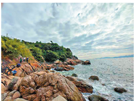
大鹿港—柚柑灣穿越線裸石紛呈，海天一色。

從西貢村到大鹿港，是一條長約4公里的崎嶇山路，上山時還好，下山時不少路段需手腳並用，拉着麻繩或藤葛往下啣溜。好不容易抵達海灘，卻發現前面根本就沒有路了，全是在疊疊巨石上攀爬。如果說穿越東涌—西涌還可以在亂石灘上跳躍前行，面對這條穿越線上遍布的大石頭，或橫臥，或豎立，或斜插，高如層樓，奇形怪狀，只能憑感覺爬上爬下，摸索前行。有些地方還需鑽過巨石搭成的夾縫，腳底要防滑，頭頂要防撞，好不驚險。4公里左右的海岸線，走了差不多5