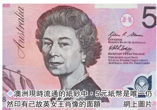
澳洲現時流通的紙鈔中，5元紙幣是唯一仍然印有已故英女王肖像的面額。