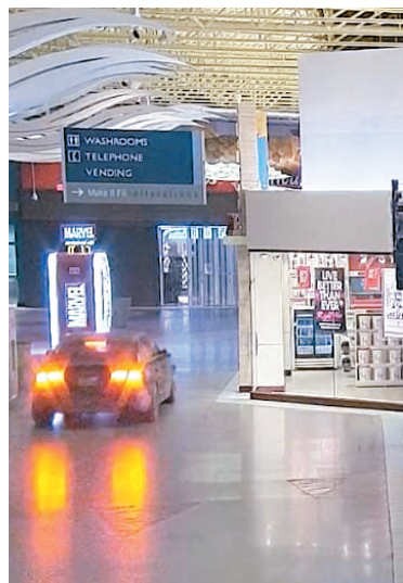
兩名賊匪駕車穿過商場走廊，途中全無障礙。

香港文匯報訊(特約記者成小智多倫多報導)加拿大安大略省周三凌晨發生一宗類似電影橋段的商場搶劫案，根據約克區警方發布的錄像，一輛載有兩名劫匪的黑色「奧迪」房車，突然撞破多倫多北旺市的Vaughan Mills商場玻璃門，然後直闖商場搶劫其中一間電子商店。