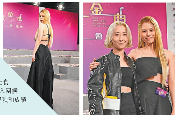
李幸倪大露背相當搶鏡。