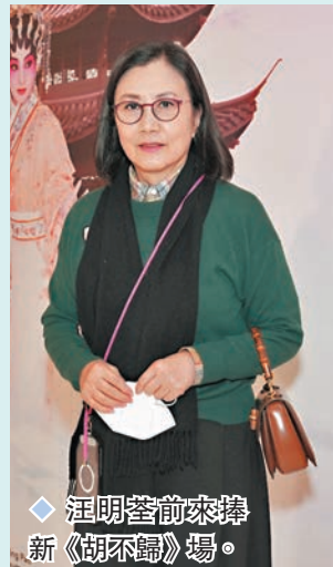
汪明荃前來捧新《胡不歸》場。