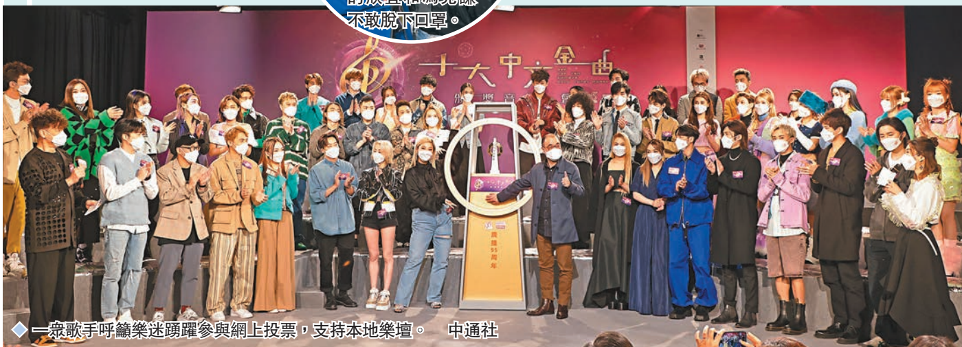
一眾歌手呼籲樂迷踴躍參與網上投票，支持本地樂壇。