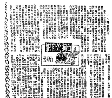
◆高傑傑作, 1954年2月12日《新晚報》。

1. 王仔走來, 猛擦一輪, 揚長而去, 真是愈窮愈見鬼也。 2. 渠想拋浪頭, 我又豈畏佢者。 3. 再三訪盧君, 路遇之電車路, 一手拉牢, 即問曰: 「汝走路乎?」盧君曰: 「不敢走路, 汝勿震!」