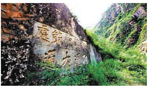
巴塘鸚鵡嘴石刻

康定是四川西部甘孜藏族自治州的首府。甘孜州位於青藏高原東南緣，是青藏高原的一部分。地處中國最高一級階梯青藏高原向第二級階梯雲貴高原和四川盆地過渡地帶。東連四川阿壩和雅安，南與四川涼山、雲南迪慶交界，西隔金沙江與西藏昌都相望，北與四川阿壩和青海玉樹和果洛相鄰。聯結四川、西藏、青海和雲南四省區，因而是中原連接西北和西南的「咽喉」，為藏漢貿易的主要集散地和茶馬互市的中心地區。