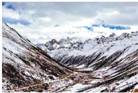
◆青高高原雀兒山

川茶輸藏和川藏茶道的開拓，促進了川藏交通的拓展和興旺，也在川藏高原上特別是甘孜州境內培育了大批市鎮。比較典型的是瀘定和康定(打箭爐)。還有出川跳板巴塘等城鎮。從甘孜州的巴塘跨過金沙江，才算真正踏進西藏。巴塘在甘孜州南部，位於青藏高原東南緣、金沙江東岸的川、滇、藏三省(區)結合部，往西與西藏的芒康、鹽井和雲南的德欽縣隔金沙江相望。扼川藏交通要衝，是川西進藏