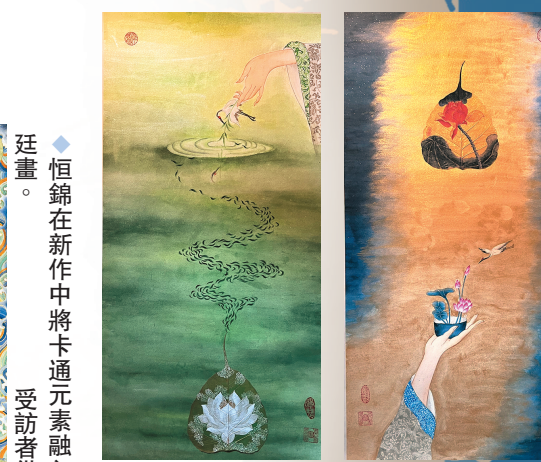
恒錦的作品常選擇經處理的菩提葉作為其中的一部分。