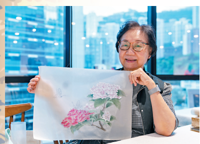
淑賢已跟隨恒錦學畫多年。