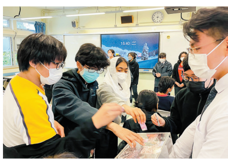
募捐活動獲得同學們的踴躍參與。

對於學生今次踴躍支持籌款活動，前地區總監及香港北角扶輪社創社社長錢樹楷博士深表感動，更認為這是一次生命影響生命的最佳體現。「從中大家都發現本地年輕人的質素很高，他們都關注世界災難，在自己有能力的情況下，盡力伸出援手。」他稱讚負責募捐活動的扶輪少年服務團成員的快速反應和行動力，感染到校內同學響應活動。