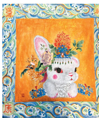
恒錦在新作中將卡通元素融入宮廷畫。