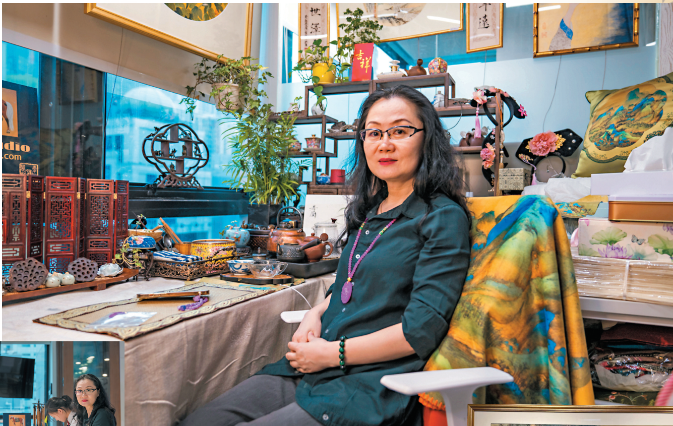
恒錦在中環開設工作室。