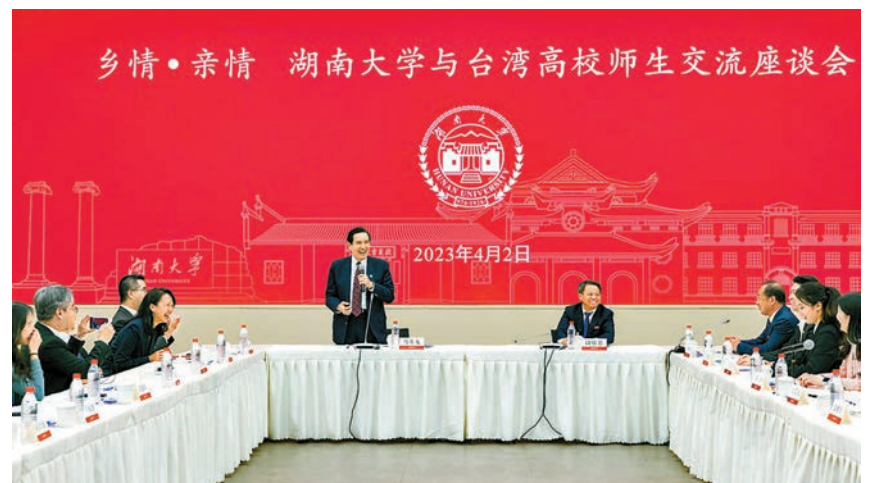
◆4月2日上午，馬英九先生帶領台灣青年學生參訪湖南大學，並與該校學生交流座談。新華社

香港文匯報訊 據新華社報道，麓山巍巍，湘水泱泱。2日上午，馬英九先生帶領台灣青年學生參訪湖南大學，並與該校學生交流座談。