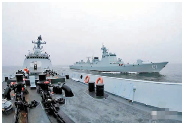
◆東部戰區海軍某驅逐艦隊太原艦、太原艦、泰州艦組成艦艇編隊，赴東海某海域開展實戰化訓練。網上圖片

宋忠平同時指出，現在美國國內反華勢力越來越囂張，對華挑釁的力度不斷加大，這有可能導致蔡英文當局會談判形勢，為此解放軍更需要加強軍事鬥爭準備。他相信，如若蔡英文當局談判形勢而走向危險路，那麼解放軍必然會出手解決問題。