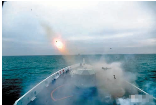
◆鎖定目標後，湘潭艦、太原艦迅速發射火箭深彈進行火力打擊。網上圖片