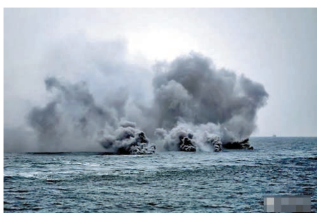
◆指揮編隊各艦進行煙幕釋放，各艦利用煙幕快速機動，佔據有利陣位。