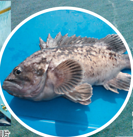
福島港灣的許氏平鮎被驗出輻射超標。圖為同一品種。