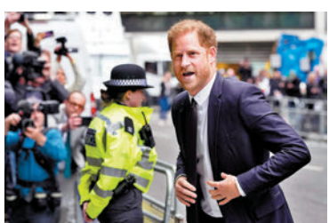
哈里昨抵倫敦高等法院。