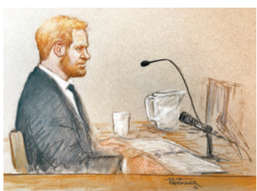
哈里作證素描圖。

哈里特別批評《每日鏡報》前編輯、英國名嘴摩根，指摩根及其團隊竊聽戴安娜的私人信息，強調母親並非如外界盛傳般是「偏執狂」，「在她於巴黎去世前3個月，她經歷了『噩夢時期』。」哈里還稱多份報章曾造謠質疑他的身世，讓他疑心重重，感到非常不舒服，因此更堅定要追究相關人士，要他們為「卑鄙且不合理的」行為負責。