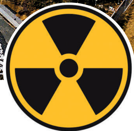
福島第一核電站核污水料最快下月排海。

共同社報道，東電稱上月在福島第一核電站港灣內捕獲的海魚「許氏平鮎」體內，放射性元素「鈾」的含量達到每千克1.8萬貝克勒爾，是日本食品衛生法規定的每千克含100貝克勒爾的180倍。