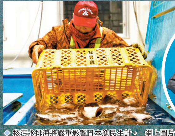
核污水排海將嚴重影響日本漁民生計。

香港文匯報訊 日本當局無視國內外強烈反對聲音，一意孤行準備把福島第一核電站的核污水排放入海。據東京電力公司表示，東電前日已開始將海水注入排放隧道，準備稀釋核污水，據報預計最快下月便啟動排放。然而東電前日發表報告，指出在福島第一核電站港灣捕獲的海魚體內，發現的放射性元素含量，是日本食品衛生法規定標準的180倍。