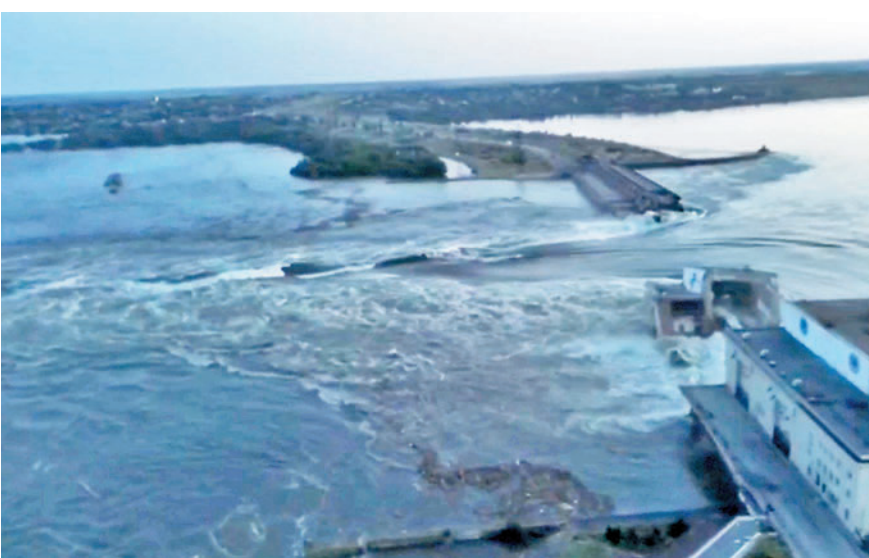
卡霍夫卡水壩受襲致決堤。

此外，這座水壩還向扎波羅熱核電廠提供冷卻水，烏國家核電公司稱，水壩損毀對核電廠構成威脅，扎波羅熱地區官員則稱，事故不會對核電廠造成嚴重影響。國際原子能機構表示正密切監控相關情況，稱核電廠沒有即時的核安全風險。