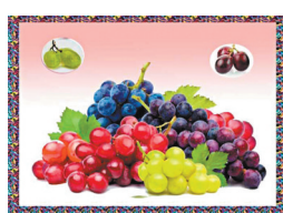
同是提子，顏色品種各不同。