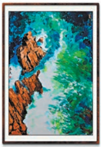
《驚濤拍岸圖》 作者供圖

一幅《驚濤拍岸圖》完成後，我意猶未盡，又再畫了一幅《狂濤擊石圖》。當我完成兩幅海浪擊石圖時，我感覺這兩幅彩墨畫不僅是「海浪處女作」，更是我對大自然敬畏之情的表達。它讓我明白，在生活的海洋中，我們也會像礁石一樣面臨無數次的海浪衝擊，但只要堅守內心的堅定，就能在風雨中屹立不倒。