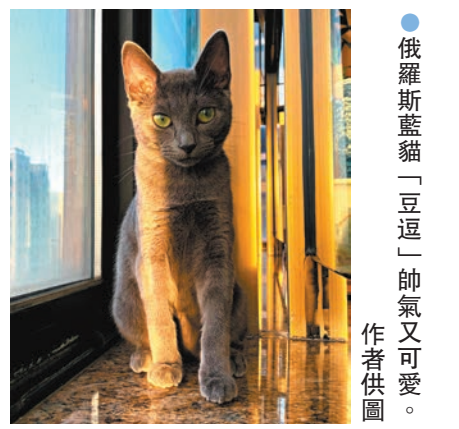
俄羅斯藍貓「豆逗」帥氣又可愛。

「豆逗」冷靜帥氣的外表，深藏熱情，最愛親近我的兒子，認定他是摯愛，每當兒子閒坐家中，就會躍到他懷裏撒嬌，享受寵抱樂趣……看着他倆親親相愛的時候，不禁感恩我們有幸過着國泰民安、太平盛世的日子——想到有些地方遭逢天災人禍，民不聊生，又遑論養貓嗎？我們真是要珍惜來之不易的和平與穩定！