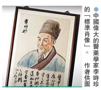
中國偉大的醫學家李時珍的「標準肖像」。作者供圖