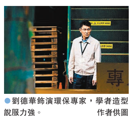
劉德華飾演環保專家，學者造型說服力強。