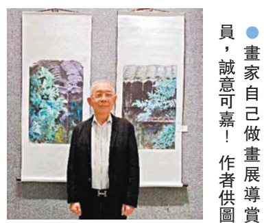
畫家自己做畫展導賞員，誠意可嘉！