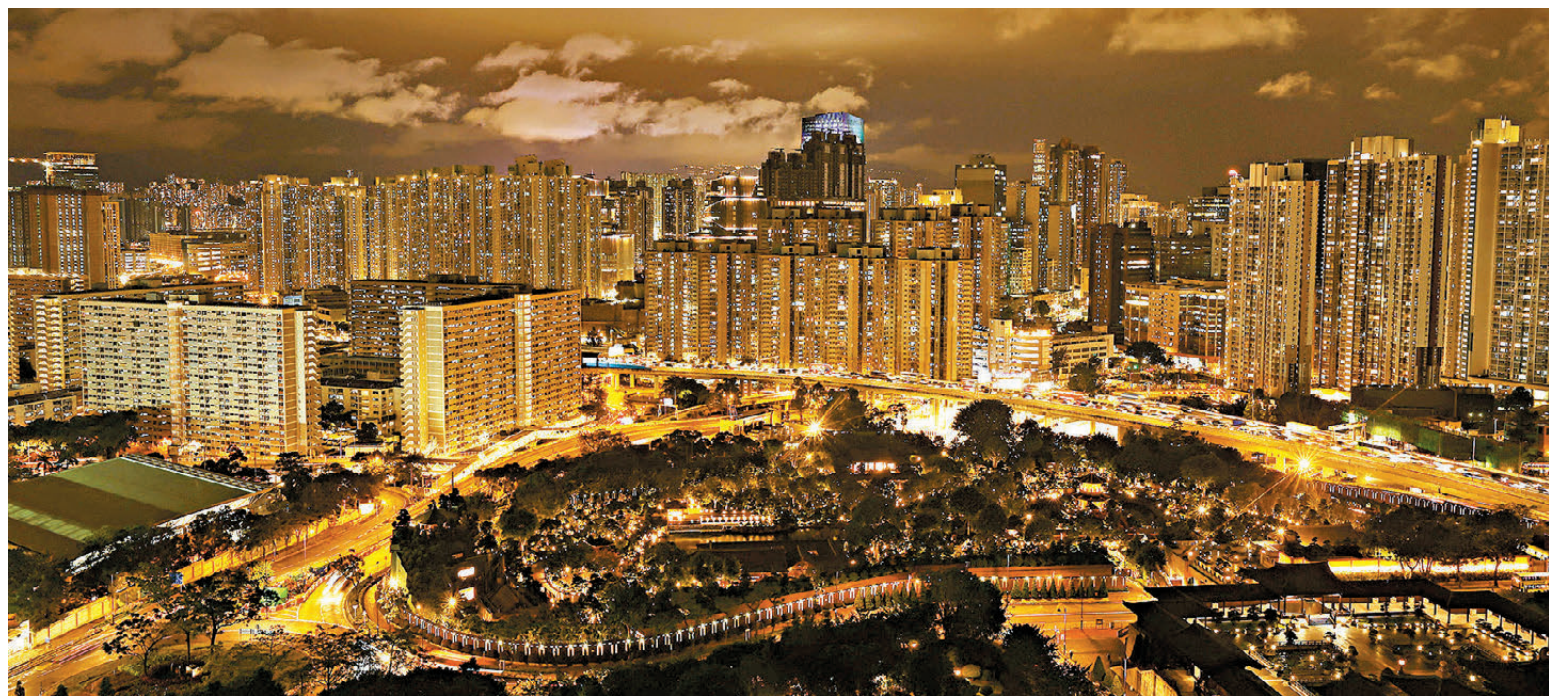
●兩電電費按年加幅俱低於1%。圖為彩虹邨一帶萬家燈火通明。