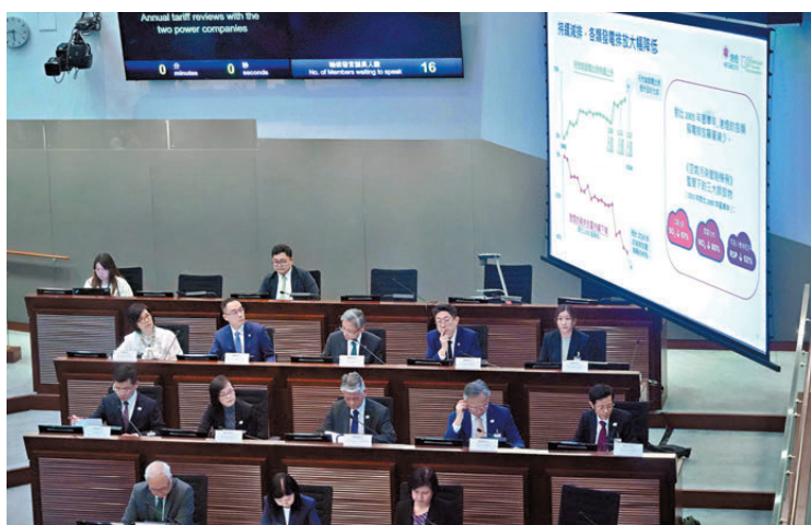
●中電及港燈於昨日的立法會環境事務委員會會議上，交代明年最新電費。