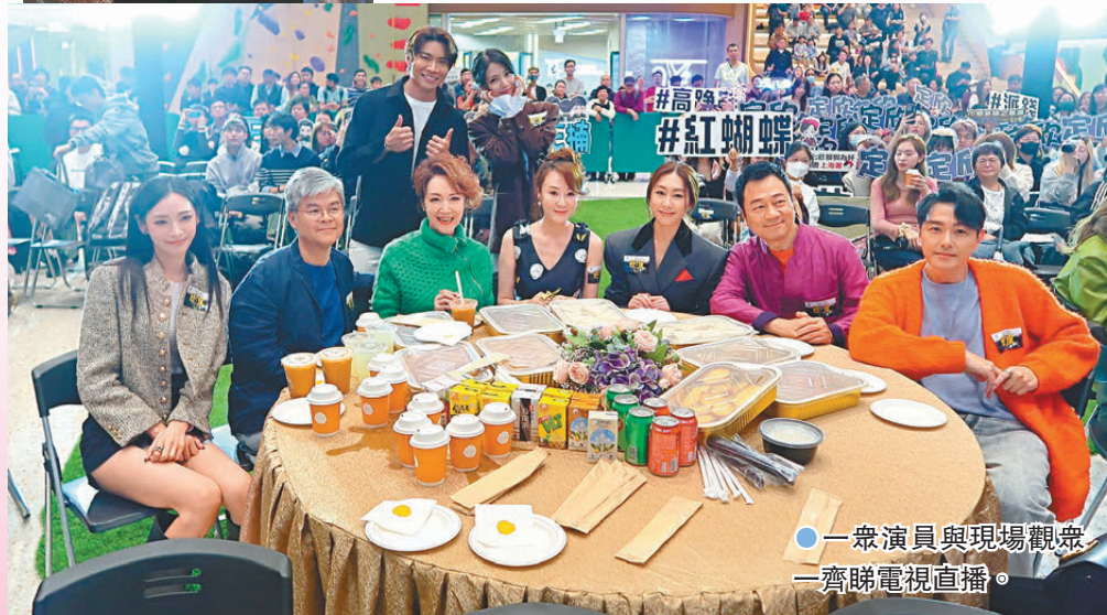
一眾演員與現場觀眾一齊睇電視直播。