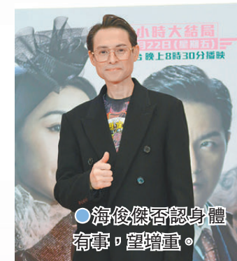
海俊傑否認身體有事，望增重。