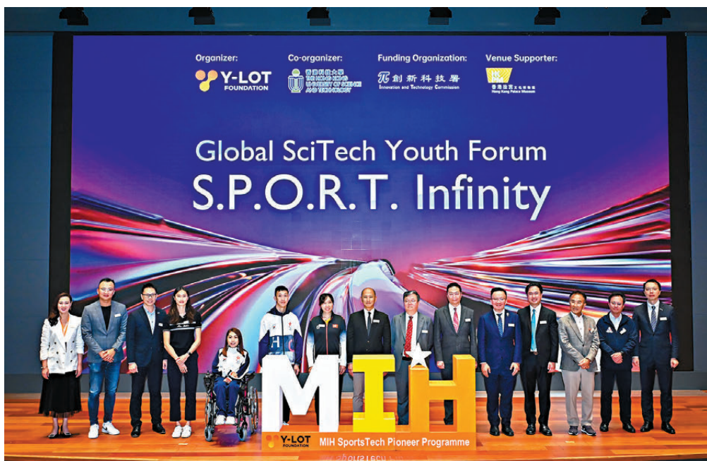
●MIH運動科技先鋒計劃期望創建一個賦能運動員、提高訓練效率並促進整體福祉的動態生態系統。