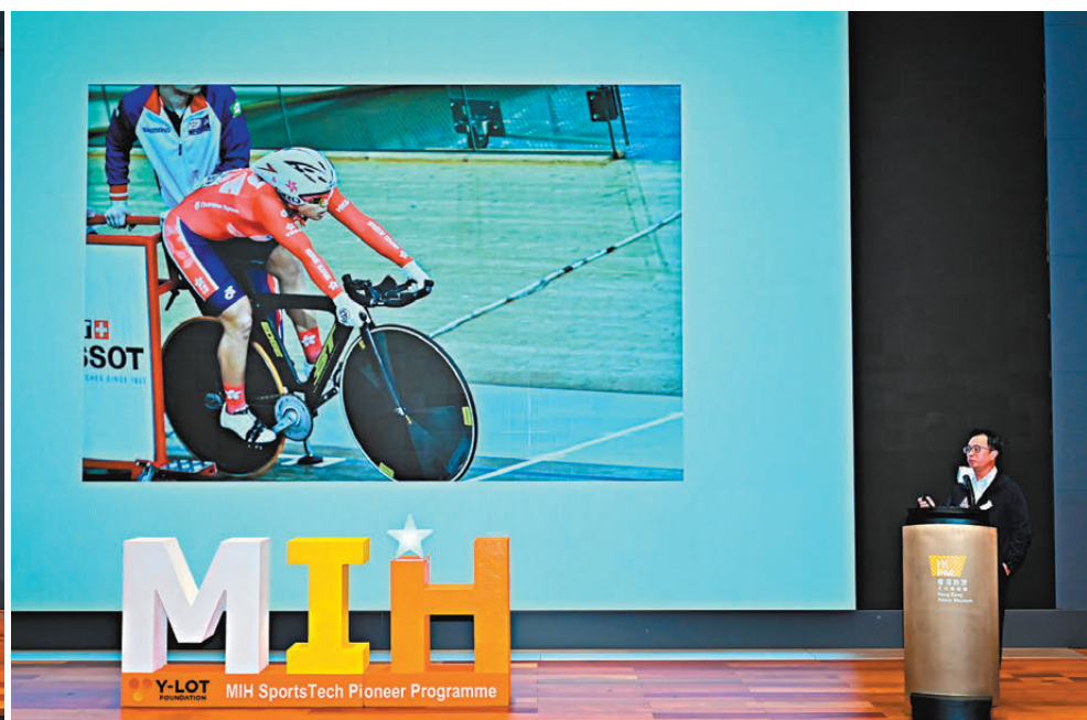
●香港將風洞技術應用在場地單車上取得一定成就。

運動與科技關係向來密不可分，由「鯊魚泳衣」到「鷹眼」及視像裁判系統等的出現，再到大眾切身的運動健身手機應用程式，科技的革新總能為運動帶來翻天覆地的變化，而人工智能（AI）的興起，更意味着運動科技將踏入全新時代。運動科技亦不單能協助運動員改善表現，更是體育產業的重要一環，香港運動科技發展雖然