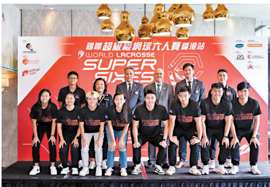
●主禮嘉賓與男女子港隊成員合照。