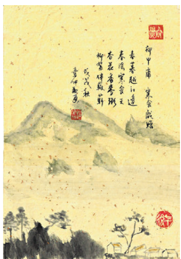
柳中庸 寒食戲贈（節選） 春暮越江邊，春陰寒食天。 杏花香麥粥，柳絮伴饅饅。 戊戌秋 素仲書畫

我們都熟悉柳中元，柳中庸是他的族弟。曾為洪府戶曹。這首詩我很喜愛，特別是「杏花香麥粥，柳絮伴饅饅。」很有意境。令我想起童年時常吃的糯米麥粥以及小公園旁簡陋的饅饅架。據資料解說，這裏的「杏花」是指「寒食粥」。《荊楚歲時記》引《鄴中記》言：「寒食日，煮粳米及麥為酪，搗杏仁煮作粥。」我童年生活在廣州，物質很缺，但人們總有辦法令飲食有些變化和趣味。簡單如用糯米加上麥米熬成粥。很奇怪，糯米的香糯軟綿加上饅不爛的麥米，吃起來有軟硬兼施的口感，下鹽為粥。只要放入冰糖，即成宵夜的甜品。舊時人們常說「五穀豐登」，今日卻是「十穀齊全」，坊間許多攤檔把十種屬穀類、豆類混合一起，稱為「十穀米」。烹調十穀米這樣食材，需時很長，適宜先泡浸數小時再煲，但至少也得煲4至5小時。最好的方法還是用真空煲，這是一個極好的發明。