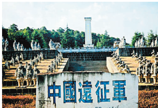
●松山遠征軍英烈雕塑群。

松山戰役遺址是第二次世界大戰遺址保存較為完整的戰場之一。現存遺址實體、文物和文獻資料有力地證明了日寇侵華事實，具有較高的史學價值，為歷史學家、軍事學家研究松山戰役提供了有力證據。松山戰役遺址是中國遠征軍愛國戰績的重要實證，是海峽兩岸遠征軍後裔憑弔先烈的場所，也是進行愛國主義和國際主義教育的直觀、生動的實物教材和課堂。2006年5月，松山戰役遺址被國務院公布為全國重點文物保護單位。龍陵縣也修復了中國遠征軍陣亡將士公墓。