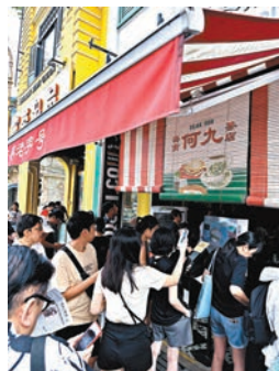
吉隆坡茨廠街現成為本地人及遊客都追捧的吃喝玩樂熱點。