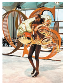
香港設計師郭子鋒作品。